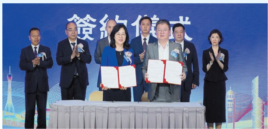
香港科技大學與河南省教育廳簽約。

河南省教育廳黨組書記、廳長毛傑表示，長期以來，在香港中聯辦、香港教育局的大力支持下，豫港兩地教育界的交流與合作日益密切，青年學子間的友誼不斷加深，期待越來越多的豫港學子雙向奔赴求學；越來越多的豫港學校開展交流合作；越來越多的豫港團組加強溝通互鑑。