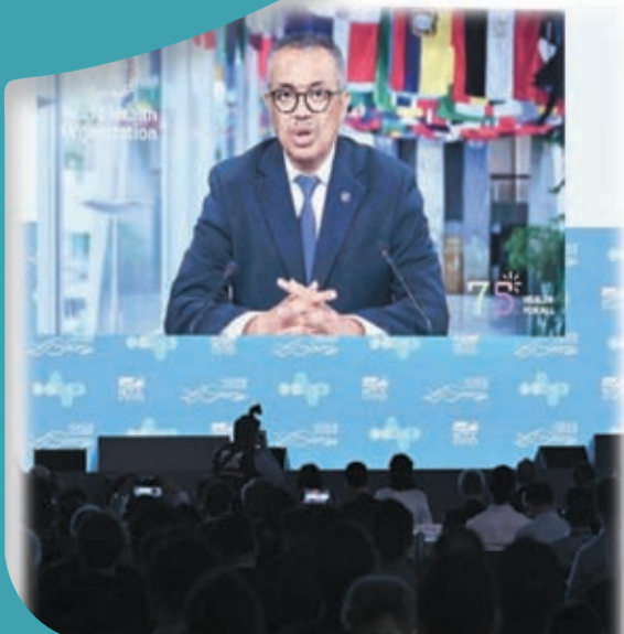
世界衛生組織總幹事譚德塞以視頻致辭。

他又稱，截至今年1月底，本港二次感染率約11%，相距日數中位數為276日，即約9個月。另外，院舍長者二次感染率為71.7%，遠高於社區長者的6.1%。他解釋，去年初院舍出現大規模感染，加上院舍檢測較頻繁，因此院舍長者被驗出再度感染的機會較高。