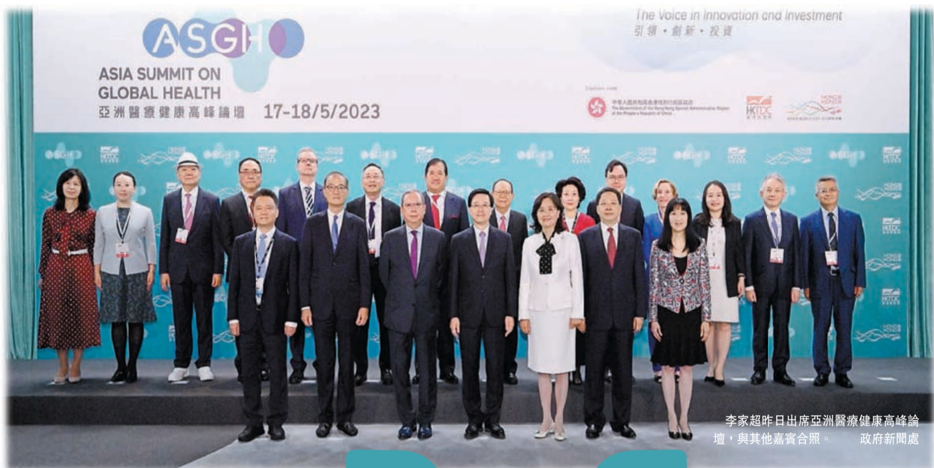
李家超昨日出席亞洲醫療健康高峰論壇，與其他嘉賓合照。