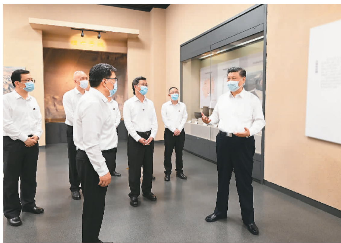
5月16日下午,中共中央总书记、国家主席、中央军委主席习近平在前往陕西西安主持中国—中亚峰会途中,在山西运城博物馆考察。

本报陕西西安/山西运城5月17日电 中共中央总书记、国家主席、中央军委主席习近平在听取陕西省委和省政府工作汇报时强调,陕西在推进中国式现代化建设中要有勇立潮头、争当时代弄潮儿的志向和气魄,奋力追赶、敢于超越,在西部地区发挥示范作用。要完整、准确、全面贯彻新发展理念,紧紧围绕高质量发展这个首要任务,着眼全国发展大局,立足陕西实际,发挥自身优势,明确主攻方向,主动融入和服务构建新发展格局,努力在实现科技自立自强、构建现代化产业体系、促进城乡区域协调发展、扩大高水平对外开放、加强生态环境保护等方面实现新突破,奋力谱写中国式现代化建设的陕西篇章。