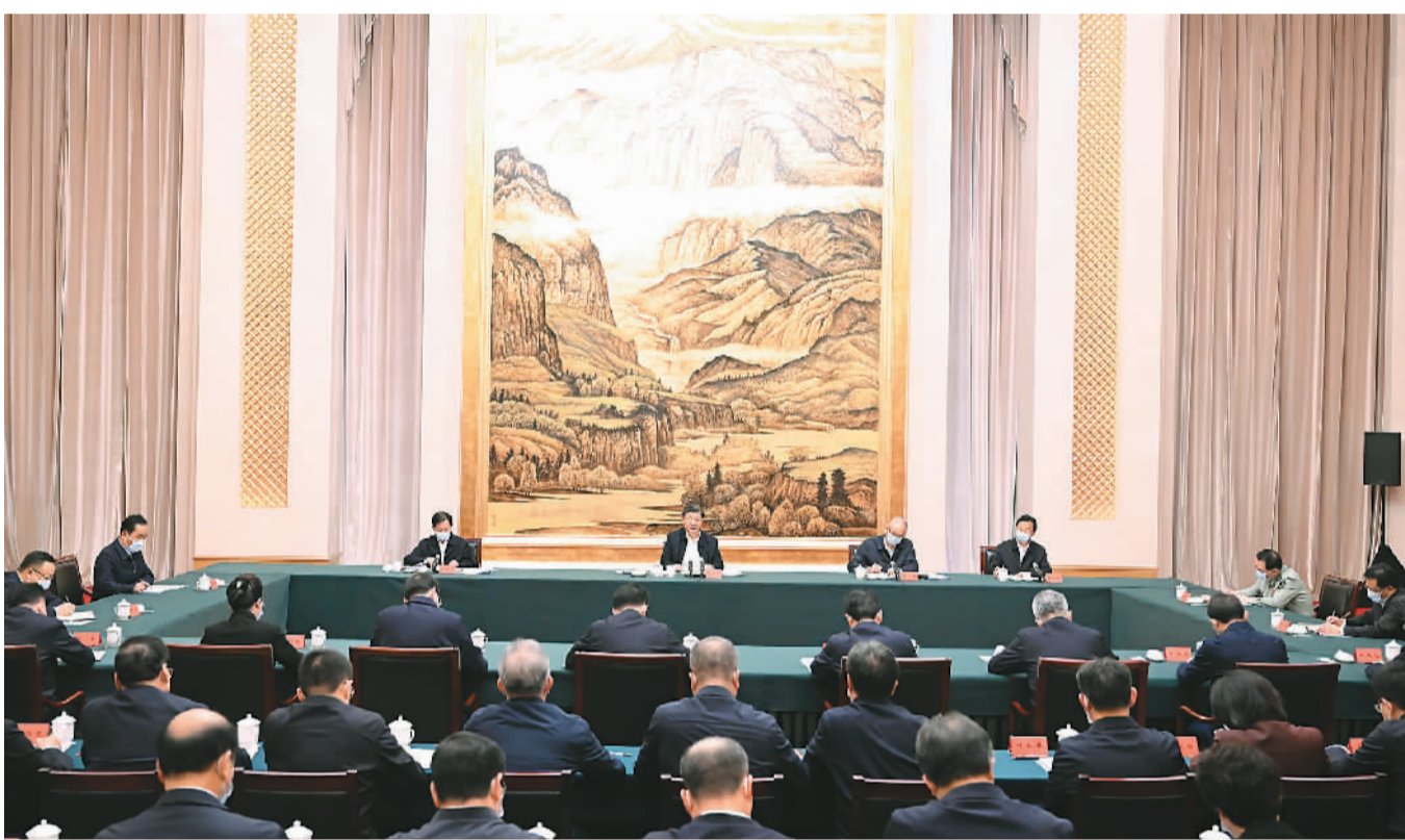
5月17日上午,中共中央总书记、国家主席、中央军委主席习近平在陕西西安主持中国—中亚峰会前夕,专门听取陕西省委和省政府工作汇报,发表了重要讲话。