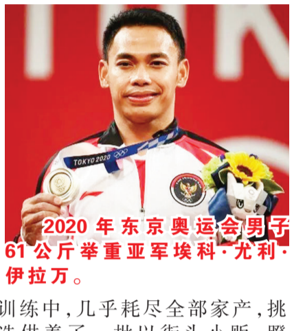
2020年东京奥运会男子61公斤举重亚军埃科·尤利·伊拉万。