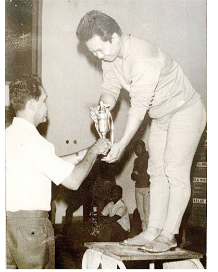
刘玉祥在国际举重比赛夺冠领奖。