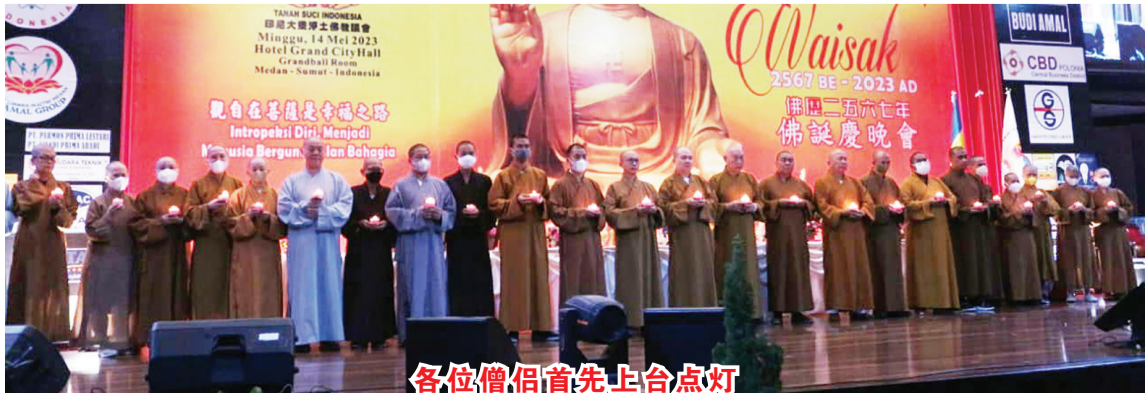
各位僧侣首先上台点灯