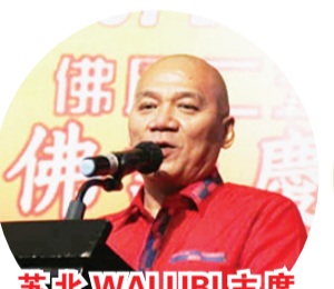
苏北WALUBI主席莫桩量致辞