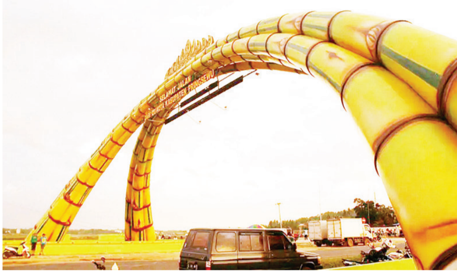
盛产竹子的楠榜普林塞乌小城，以竹子造型建造的千竹门。