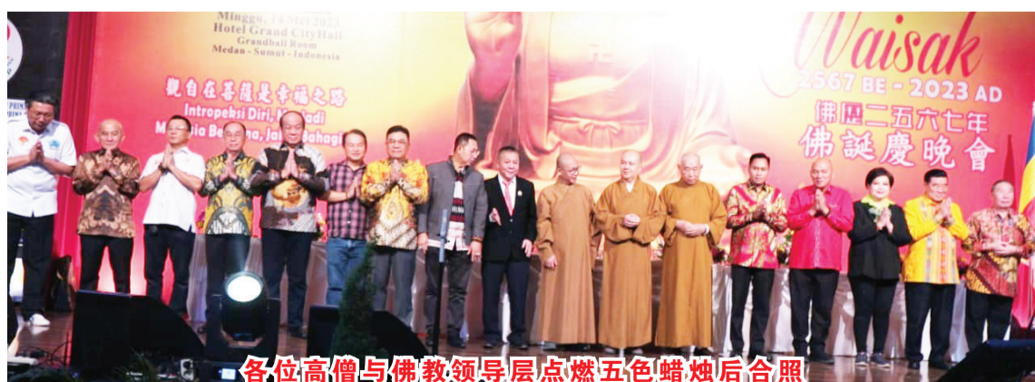
各位高僧与佛教领导层点燃五色蜡烛后合照