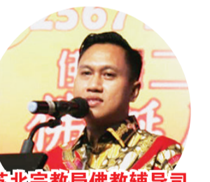
苏北宗教局佛教辅导司长Dr. Sulistyjo致辞

【本报讯】印尼苏北大乘佛教净土议会 Majabumi Tanah Suci Indonesia Sumut (MTSI Sumut) 于5月14日星期日晚上7时，假座棉兰 The Grand City Hall 大酒店二楼宴会厅举办佛历2567年佛诞庆晚会，主题是“观自在菩萨是幸福之路”。