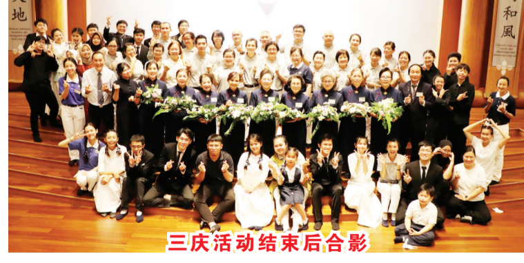
三庆活动结束后合影