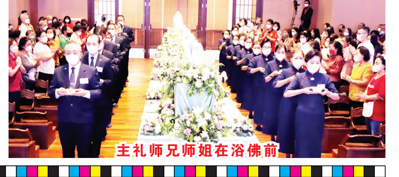
主礼师兄师姐在浴佛前