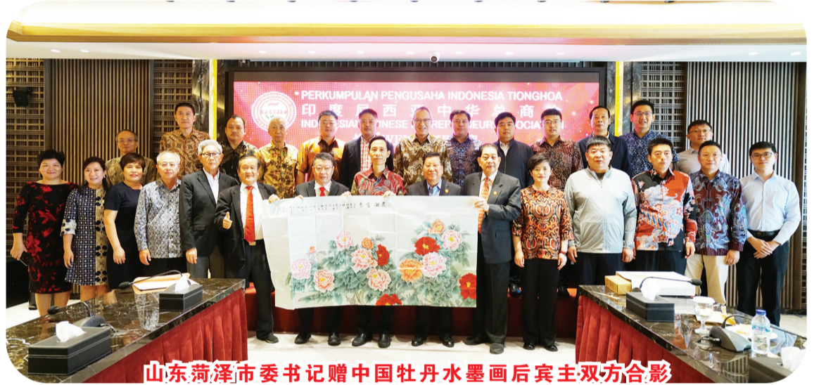
山东菏泽市委书记赠中国牡丹水墨画后宾主双方合影