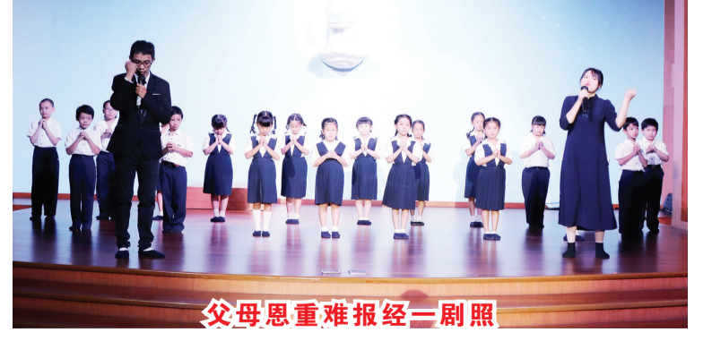
父母恩重难报经三剧照