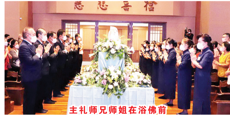
主礼师兄师姐在浴佛前