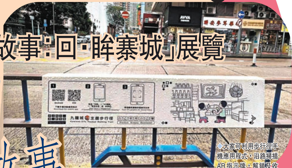
大家可利用步行徑手機應用程式，沿路掃描AR指示牌，解鎖及收聽聲音故事。

香港的都市傳奇衆多，九龍城寨的「暗黑歲月」早已成為一段回憶，城寨拆遷後，將原址改建為公園。懷舊之風加之保育的潮流蔓延，九龍城當之無愧成為其中一處被重視的寶地。為了讓更多市民認識寨城，香港聖公會福利協會由2018年開始策劃，當中的九龍城主題步行徑全長6.5公里、分為5個路段，北端以九龍寨城公園為起點，途經宋皇臺、土瓜灣，連接至南端的紅磡聖母堂。而是次，則加入了AR互動裝置，「聽」說城寨故事。