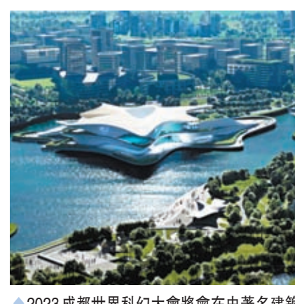
◆2023 成都世界科幻大會將在由著名建築團隊 Zaha Hadid Architects 所設計的成都科學館（暫定名）中舉行。

意不同文化背景下的人們以科幻之名歡聚成都。」2023 成都世界科幻大會榮譽主賓、著名科幻作家劉慈欣在致辭中表示，成都是一座和科幻關係密切的城市，中國科幻從這裏出發，在這裏生根發芽，希望2023 成都世界科幻大會能融入成都獨有的科幻粉絲文化，匯集中國科幻文化和源於1939年的世界科幻大會文化，共