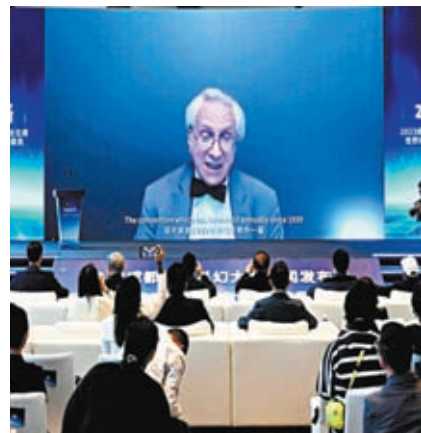
◆2023 成都世界科幻大會聯合主席本·亞洛線上致辭。