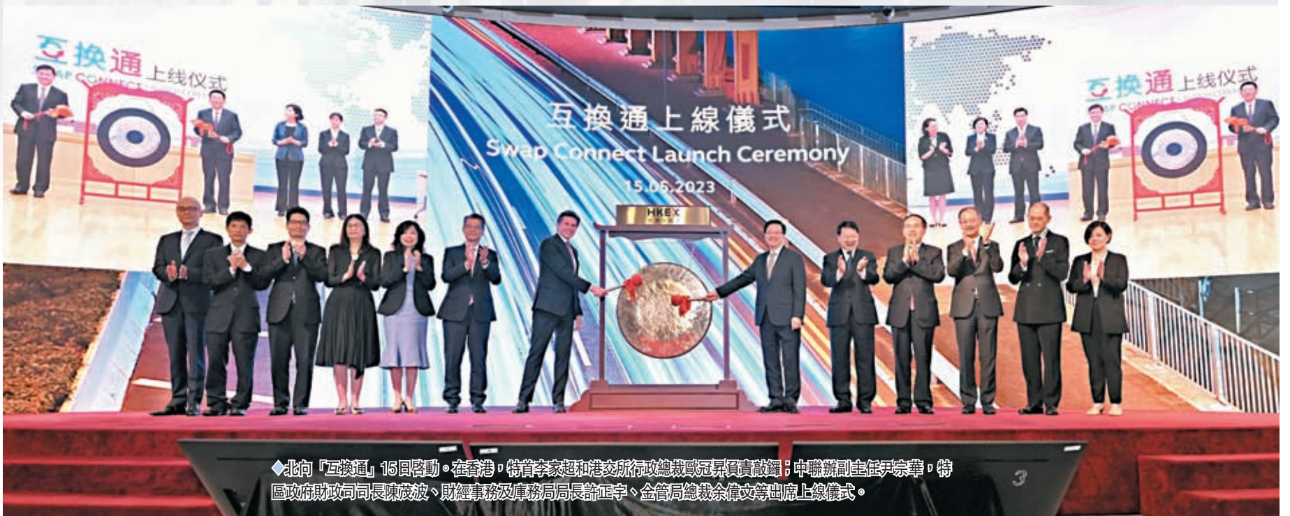
◆北向「互換通」15日啟動。在香港，特首李家超和港交所行政總裁歐冠昇負責敲鑼；中聯辦副主任尹宗華，特區政府財政司司長陳茂波、財經事務及庫務局局長聶偉正、金管局總裁余偉文等出席上線儀式。

北向「互換通」15日啟動，首日成交合約共涉82.59億元人民幣。香港特區行政長官李家超表示，北向「互換通」是首次在金融衍生工具領域引進互聯互通安排，新措施將強化香港作為全球最大的離岸人民幣業務中心和國際風險管理中心的地位。國務院港澳辦副主任王靈桂則指，中央支持香港與內地不斷提升金融合作水平，助力國家穩步推進金融市場對外開放，吸引更多國際資本到內地投資，分享中國的發展紅利，並在過程中不斷增強香港競爭優勢，推動香港經濟實現更高品質發展。