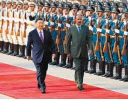
◆5月15日下午，伊薩亞斯在習近平陪同下檢閱中國人民解放軍儀仗隊。

「我們敦促美日等G7國家，身為『富國俱樂部』成員，不能只從G7等少數國家利益出發，損害國際社會絕大多數國家的利益，而應順應開放包容的時代大勢，多想想如何為世界的和平、穩定與發展做些實實在在的好事。」汪文斌說，「日本作為G7輪值主席國不要為虎作倀，不要做經濟脅迫的同謀和幫兇。」