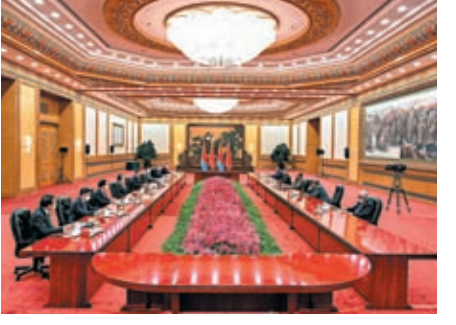
◆5月15日下午，習近平在人民大會堂同伊薩亞斯舉行會談。