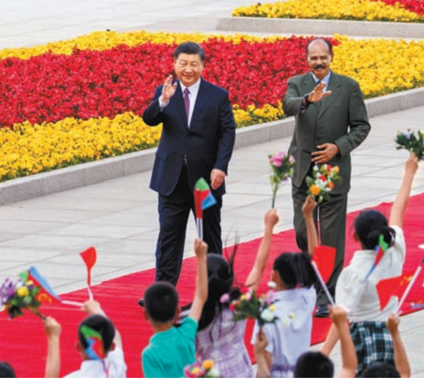
◆5月15日下午，中國國家主席習近平在北京人民大會堂東門外廣場為厄立特里亞總統伊薩亞斯舉行歡迎儀式。圖為會談前，習近平在人民大會堂東門外廣場為伊薩亞斯舉行歡迎儀式。