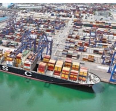
◆中國國家統計局16日發布數據顯示，4月份，貨物進出口總額34,347億元人民幣，同比增長8.9%。圖為「地中海凱蒂」輪在遼寧港口集團大連集裝箱碼頭首航。資料圖片

付凌暉強調，下階段，要把發揮政策效力和激發經營主體活力結合起來，積極恢復和擴大需求，加快建設現代化產業體系，促進經濟實現質的有效提升和量的合理增長，着力推動經濟高質量發展。