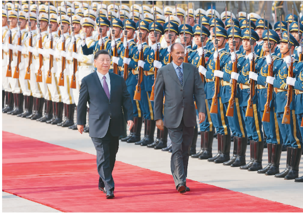
5月15日下午,国家主席习近平在北京人民大会堂同来华进行国事访问的厄立特里亚总统伊萨亚斯举行会谈。这是会谈前,习近平在人民大会堂东门外广场为伊萨亚斯举行欢迎仪式。