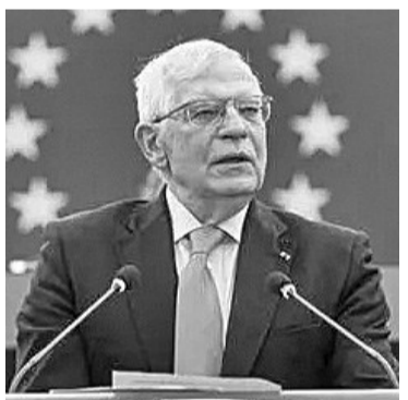
欧盟外交与安全政策高级代表博雷利

汪文斌：美方应当反思自身在乌克兰问题上应负的责任，停止胁迫他国选边站队，停止对别国进行污蔑抹黑。相信多数国家都希望通过和平解决乌克兰问题，而不是像美方那样向其他国家出售武器、拱火浇油。