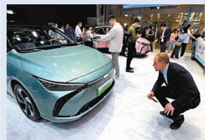
外商蹲在地上看吉利幾何。