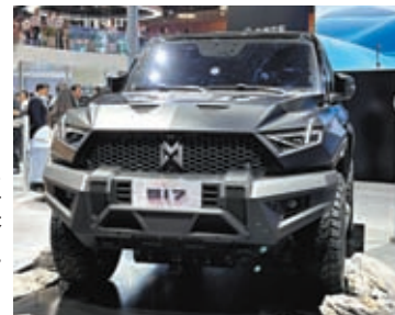
售價最高至160萬元人民幣的東風猛士917。

除了性價比制勝外，「國產之光」同樣也在高端市場上嶄露頭角。在車展舉辦的那幾日，經常可以看到成群結隊的老外組團去「仰望」——一款比亞迪旗下的高端品牌車。車展上，仰望品牌發布的豪華硬派越野車型「仰望U8」售價公布為109.8萬元。敢於定位百萬元級別的國產車還包括東風，其在車展發布的「猛士917」定價在70萬至160萬元。「時代真是變了，前幾年的車展還是大家圍着賓利、蘭博基尼、勞斯萊斯等打卡拍照，今年車展人全擠在國產車展位這裏。」有觀眾在現場感嘆，曾經百萬級別的豪華車全由外資或合資品牌壟斷，如今輪到中國品牌來樹立新地位了，有「讓世界重新認識中國汽車」之豪氣。