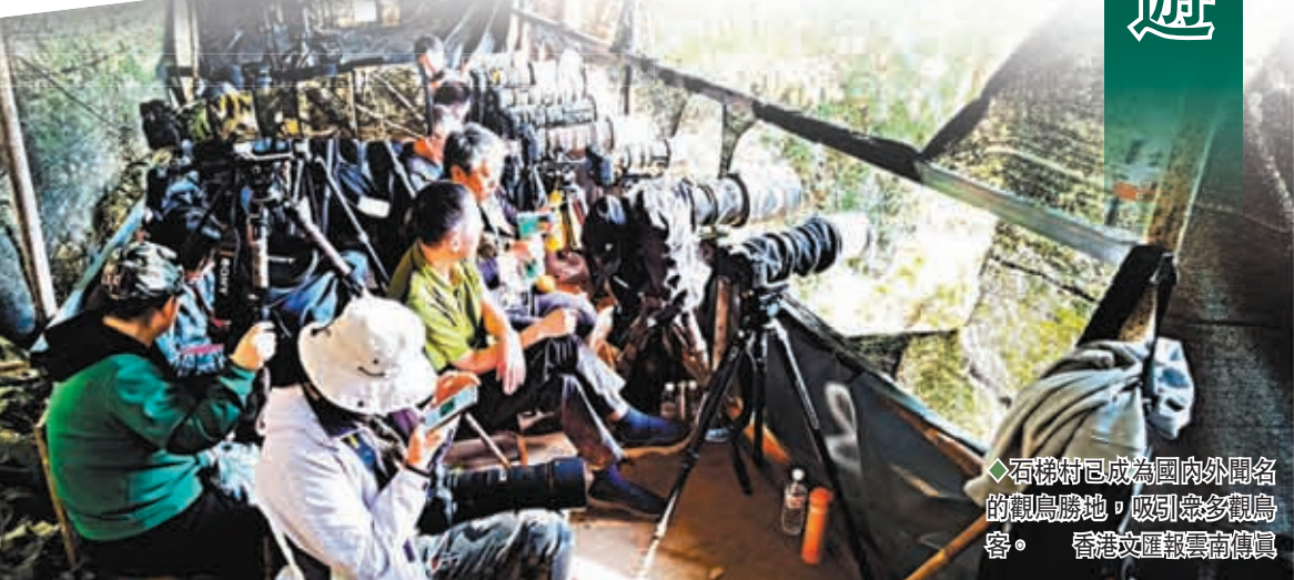
石梯村已成為國內外聞名的觀鳥勝地，吸引眾多觀鳥客。