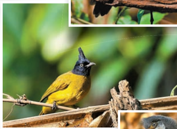
◀ 黑冠黃鸝