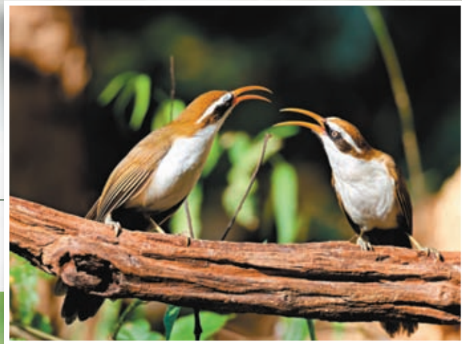
▶ 棕頭鈎嘴眉 香港文匯報雲南傳真