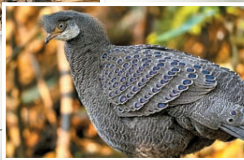
▶ 灰孔雀雉