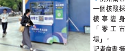
◆杭州開市一個核酸採樣亭變身「零工市場」。