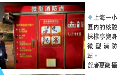
◆上海一區內的核酸採樣亭變身微型消防站。