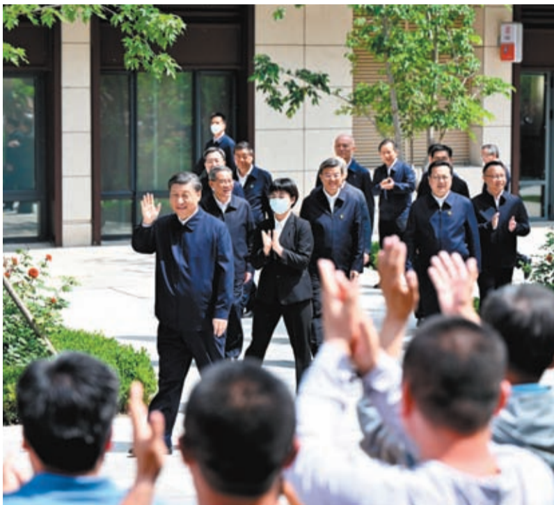
5月10日，中共中央總書記、國家主席、中央軍委主席習近平在河北省雄安新區考察，並主持召開高標準高質量推進雄安新區建設座談會。這是10日上午，習近平在容東片區南文營社區考察時向社區居民揮手致意。新華社

習近平強調，要堅持人民城市人民建、人民城市為人民，解決好雄安新區幹部群眾關心的切身利益問題，讓人民群眾從新區建設發展中感受到實實在在的獲得感、幸福感。要堅持就業優先，完善就業創業引導政策，加強對新區勞動力的再就業培訓。要推進城鄉統籌發展，在縮小城鄉差距、推動城鄉融合發展、促進全體人民共同富裕上闖出一條新路來。 習近平指出，雄安新區黨工委及各級黨組織要認真開展主題教育，並以此為契機，加強調查研究，推動思想大解放、能力大提升、作風大轉變、工作大落實，進一步提升政治功能和組織功能。要持續糾治「四風」，一體推進不敢腐、不能腐、不想腐，以「廉潔雄安」保障「雄安質量」。