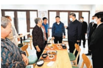
習近平10日在容東片區南文營社區食堂同就餐的社區老人親切交流。

習近平同社區工作人員、現場辦事群眾、就餐的社區老人等親切交流，仔細查看民情台賬，對社區開展的便民養老服務等表示肯定。總書記指出，建設好雄安新區，重要的是銜接好安居和樂業，讓群眾住得穩、過得安、有奔頭。要同步推進城市治理現代化，從一開始就下好「繡花」功夫，積極推進基本公共服務均等化，構築新時代宜業宜居的