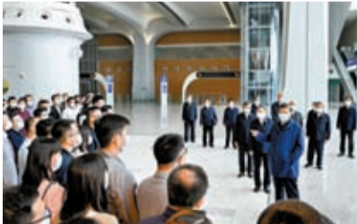
10日上午，習近平在雄安站候車大廳同旅客親切交流。

總書記來到雄安城際站及國貿中心項目建設現場，看沙盤、登平台，遠眺建設工地，了解啟動區重大基礎設施項目及重點疏解項目規劃建設進展情況。習近平指出，交通是現代城市的血脈。血脈暢通，城市才能健康發展。要在建設立體化綜合交通網絡上下功夫，在充分利用地下空間上下功夫，着力打造一個沒有「城市病」的未來之城，真正把高標準的城市規劃藍圖變為高質量的城市發展現實畫卷。