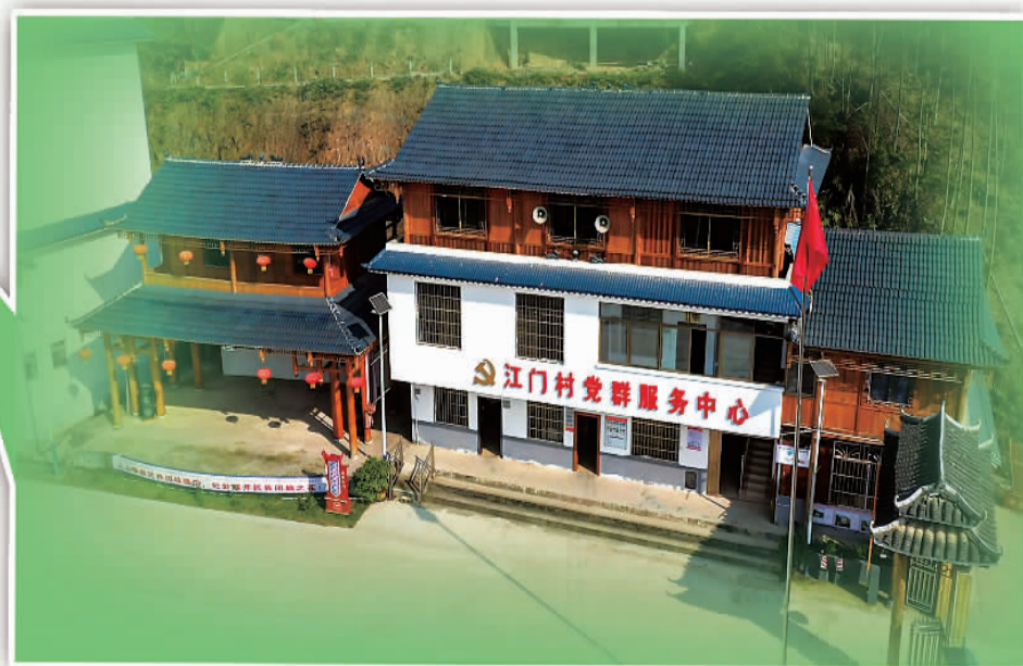
▼江门村党群服务中心。