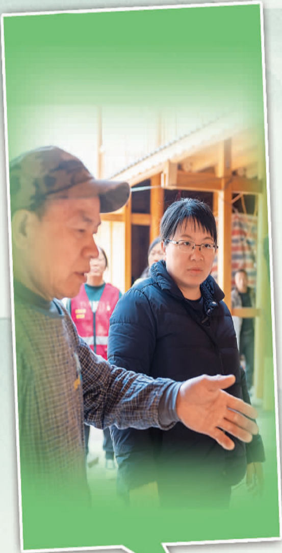
▼江门村在建的村史馆。