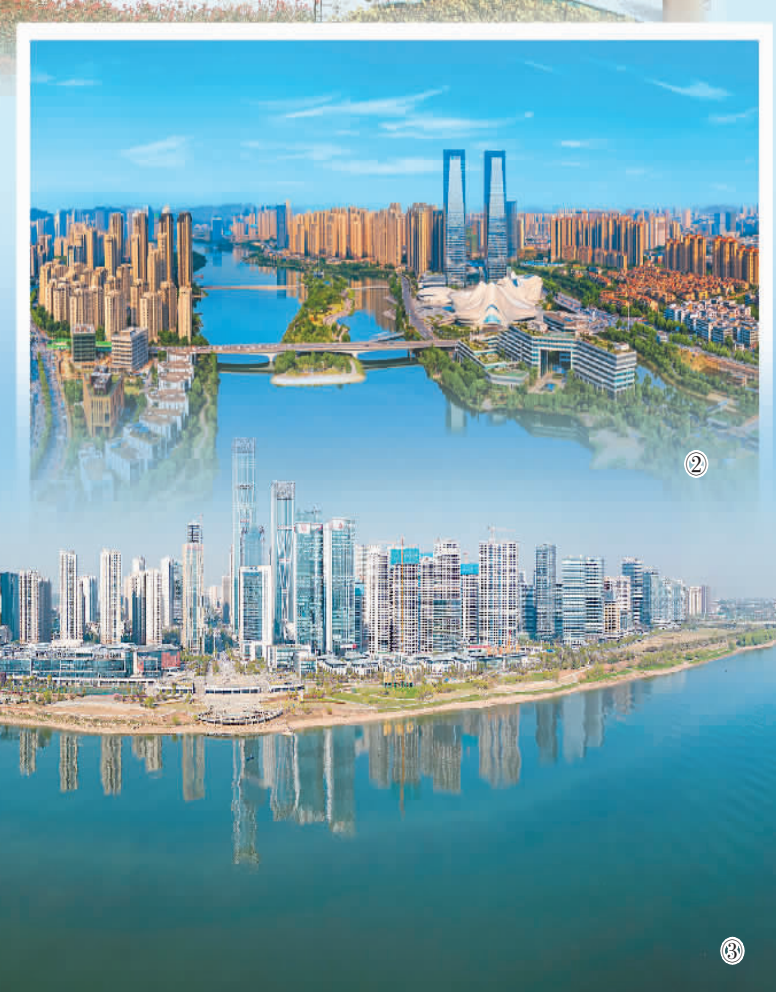
图③：位于湘江新区的湖南金融中心。