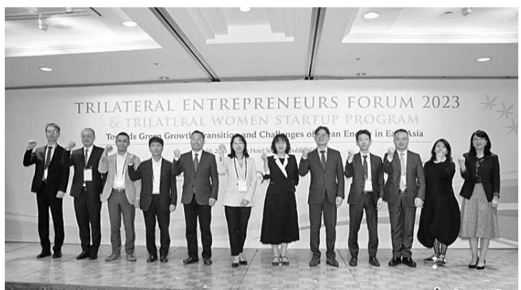
当地时间10日,2023年中日韩企业家论坛在韩国首尔举行。图为2023年中日韩企业家论坛开幕式现场。

本次论坛主题为“面向绿色增长:东亚清洁能源转型与挑战”,邀请三国政府官员、商界领袖和学界专家齐聚一堂。中国国际商会、日本经济团体联合会和韩国全国经济人联合会等对论坛给予大力支持。当天,秘书处还背靠背举办了中日韩女性创业计划,旨在为女性创业者提供平台与指导,推动中日韩和东盟成员国之间的商务交流,并扩大女性创业者商业网络。在论坛开幕式现场,秘书处副秘书长坂田奈津