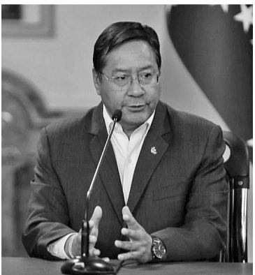
玻利维亚总统阿尔塞

【环球网报道】英国路透社报道,玻利维亚总统阿尔塞在周三(10日)的新闻发布会上表达了对使用人民币进行国际贸易持开放态度,他提到拉美的两大