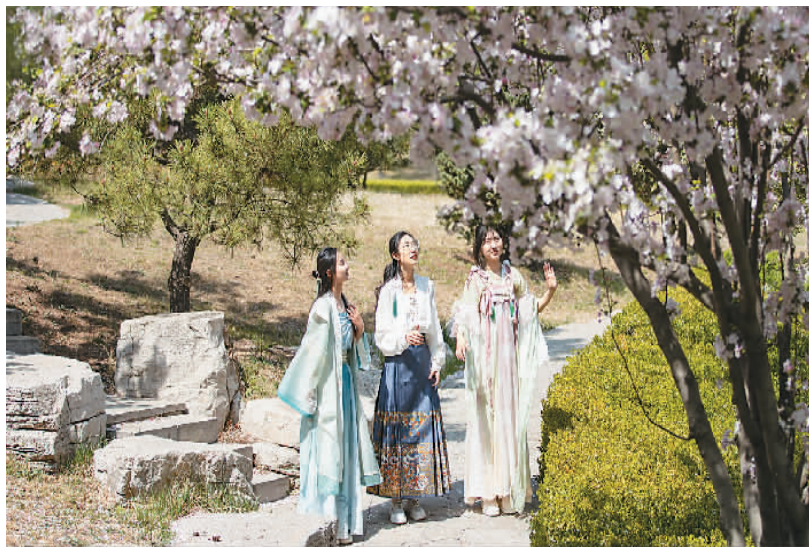
山东省广饶县孙子文化旅游区里，以“梦回春秋·最美花朝”为主题的汉服花朝节吸引游客身着汉服“打卡”旅游。