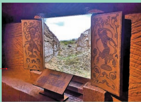
◆館藏國寶級文物：唐胡旋舞圖石刻門扇