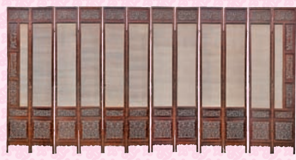
◆清初黃花梨十二扇屏風