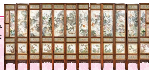
◆清嘉慶御製粉彩道仙人物圖瓷板十二開屏風

更有鑲嵌有瓷板的多扇圍屏。以筆者所收藏的一組「清嘉慶御製粉彩道仙人物圖瓷板十二開屏風」為例，工匠卻運用巧思，在溫潤的紫檀木框中加入陶瓷元素，十二扇屏風屏心長方形瓷板以不同的道教仙人為主題，下方正方形裙板則繪有代表着十二個不同月份的鮮花，遠眺大氣典雅，細觀耐人尋味，按順序觀賞彷彿在閱讀一幅展開的書卷，文雅至極。