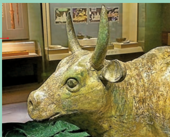
◆館藏國寶級文物：西夏鎏金銅牛頭部