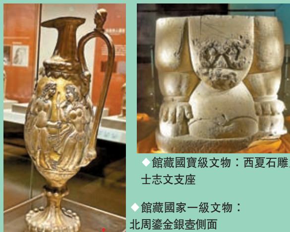
◆館藏國寶級文物：西夏石雕力士志文支座