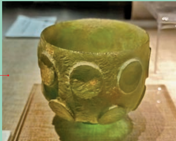
◆館藏國家一級文物：北周凸釘玻璃碗

這件臥牛身長1.2米，寬38厘米，高44厘米，重188公斤。全身散發着柔和的金光，四腿呈內屈伏狀；牛首高抬，兩角彎出優美的弧度，頸部寬厚有力，皮膚皺痕明顯；尤其是雙眼炯炯有光，卻又呈現溫馴之態，神情極似魯迅先生筆下的「孺子牛」。經考證，這隻銅牛是王陵的陪葬之物。1977年出土於寧夏回族自治州銀川市西百陵101號墓，現藏於寧夏博物館。這件鎏金銅牛體形碩大，比例勻稱，集鑄造、鑄造、鎏金、拋光等工藝於一體，真實地反映了西夏青銅鑄造工藝的高超水平，是目前中國最大最完整的西夏鎏金工藝品，也為專家研究西夏社會的農業經濟提供了一個實物佐證。