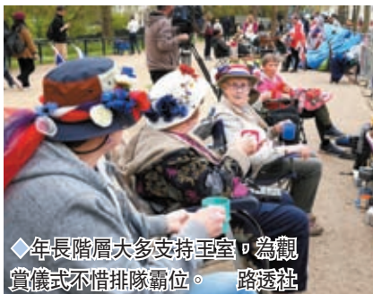
年長階層大多支持王室，為觀賞儀式不惜排隊霸位。