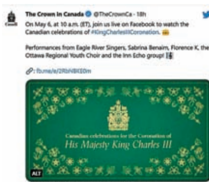
加拿大政府在官方網站詳細推介各項慶祝英王加冕活動。

這封信是由澳洲、以及幾個曾被掠奪為奴隸的加勒比國家原住民領袖所簽署。前奧運選手柏瑞斯是第一位當選澳洲聯邦議會議員的原住民女性，她是簽署這封信的領袖之一。身為澳洲與王室關係的堅定批評者，柏瑞斯說，現在是「承認殖民化的可怕且持久影響、以及許多原住民人口所感受到的種族滅絕遺留問題」的時候了。她表示，在加冕典禮這一週，去討論和教育人們了解殖民化背後真相至關重要。