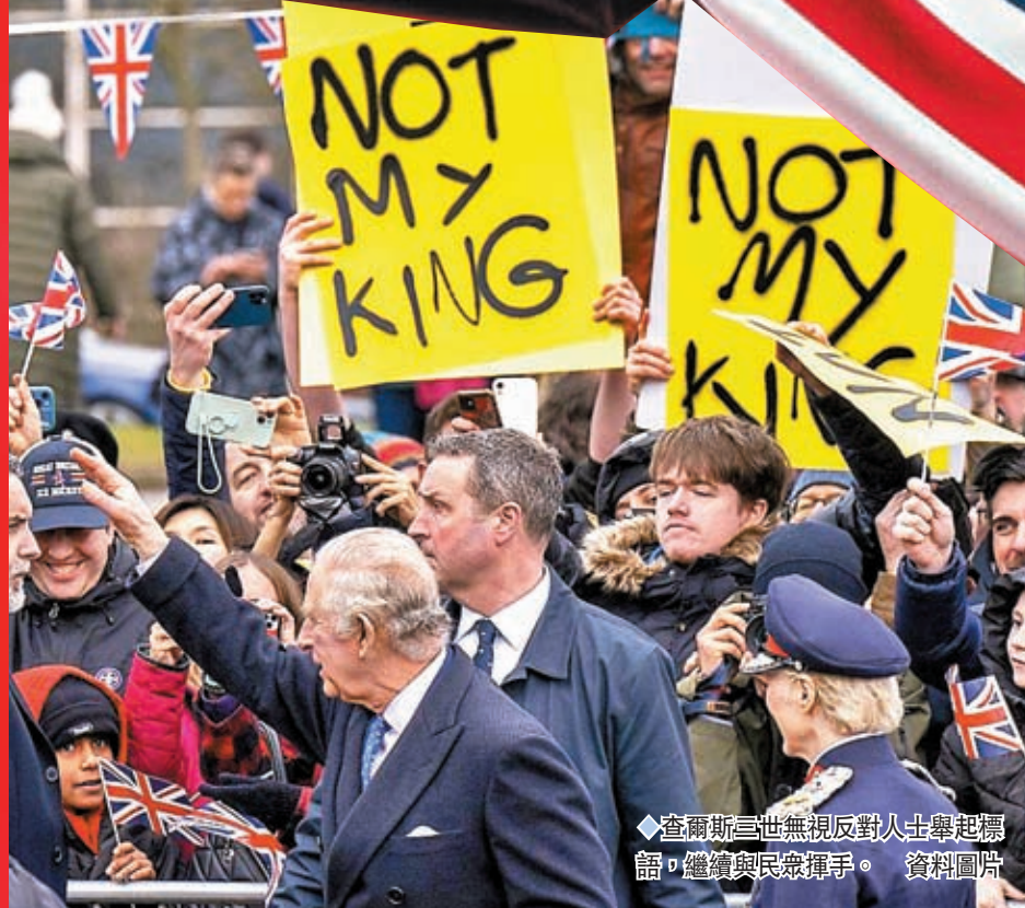
查爾斯三世無視反對人士舉起標語，繼續與民眾揮手。資料圖片

香港文匯報訊（特約記者 余家昌 報道）英王查爾斯三世的加冕典禮6日舉行，這場相隔70年來首次舉行的儀式，原意是用來提升英國國民對新國王及王室支持度，如今卻成為引發對英國君主制存廢的一場大辯論的契機。多項英國民調顯示，儘管當前仍有剛好過半數英國人支持維持君主制，但愈年輕組別對王室的支持度就愈低，意味再過20年甚至只要10年，支持延續君主制的英國人就可能不過半數。不少共和制支持者都認為，英國國民將會從這次機會開始反思君主制的存在意義，甚至可以令該儀式成為英國「最後一次加冕典禮」。