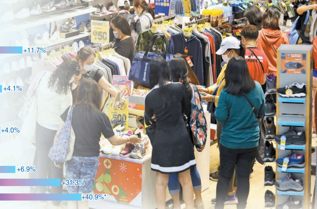
註：*臨時數字，在日後會作出修訂 資料來源：政府統計處

【香港商報訊】本港3月零售業總銷貨價值及銷貨量升幅均創新高。港府統計處昨日公布，3月零售業總銷貨價值的臨時估計為336億元，按年升40.9%，略低於市場預期的41.2%，但遠高過1、2月合計的按年升幅17.3%。扣除價格變動後，3月零售業總銷貨數量估計按年升39.4%，亦高於1、2月合計按年15.5%的升幅。總計首季零售業總銷貨價值估計升24.1%，銷貨量升22.3%。