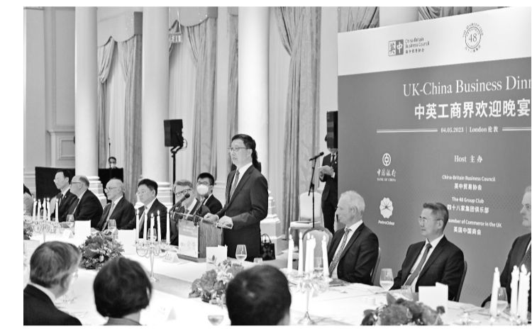
韩正出席中英工商界举办的友好人士欢迎晚宴并致辞

国‘冷落’美国,对与美方的接触‘缺乏兴趣’。”《环球时报》上月20日的社评中提到,中国外交常说的一句话是“听其言观其行”,但对今天的美国,“听其言”已然显得是浪费时间了,因为美方把说一套做一套玩到了极致,“其言”已经在中国和国际社会丧失了诚信。据美媒披露,华盛顿即将出台“史无前例”的对华投资限制;美国对台湾问题的干涉正变本加厉;美国对中国的全面遏制打压也没有任何收敛。“中国的大门始终是敞开的,等美国人拿出诚意并展现出相关务实行动之时,中美在各领域加强沟通交流自然会水到渠成,这也会是国际社会期待看到的结果。”社评说。