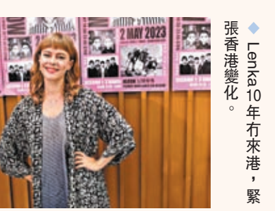
Lenka 10年冇來港，緊張香港變化。

兒，很高興可以再來香港，除開騷外會多留一天，笑言雖然時間不多，也要快閃到處觀光Shopping，看看十年來香港的變化。她表示向來喜歡亞洲市場，多年來也有與亞洲粉絲保持聯絡，雖然正在巡迴四處飛很辛苦，但之前到峇厘島演出時提早到了，順道先給自己休息，做Spa放鬆一下。她坦言疫情爆發後對她影響很大，2020年3月剛推出新碟，受影響下銷量十分差，所有演唱工作也要暫停，這日子她除了湊仔女，也會繼續練歌，創作音樂，之後會再有新歌推出。