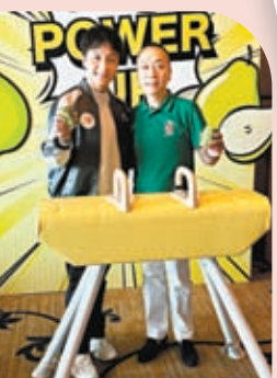
有本土冠軍才有世界級冠軍，李小雙鼓勵小方繼續努力。