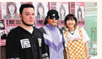
「怕胖團」三人都是星爺的粉絲。