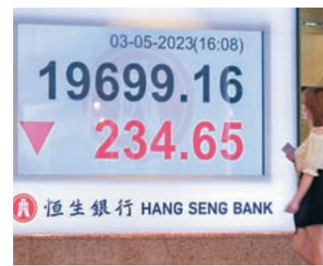
◆港股3日一度跌近400點，收市跌幅收窄，但仍失守250天牛熊分界線。

葉尚志認為，恒指現受制於20,200點反彈阻力以下，在未能升超此阻力位前，下探尋底行情趨勢未有改觀，建議對後市發展還是保持謹慎觀察的態度。