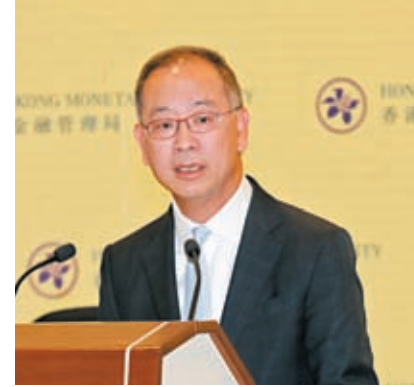
◆市場料美聯儲將再加息，憂慮資金或再加快流出港元，余偉文3日派定心丸。 資料圖片

香港文匯報訊（記者 馬翠媚）市場料美聯儲將再加息，在港銀體系總結餘跌穿500億元（港元，下同）以下，市場憂慮資金或再加快流出港元，或令銀行體系總結餘「歸零」，不過香港金管局總裁余偉文3日在網誌《匯思》撰文派定心丸指，銀行體系總結餘只反映銀行在港元「交收平台」上的總流動性，因此着眼點應放在整個銀行體系可以動用資金，而綜合近期隨着銀行體系總結餘下降的港元市場運作情況，銀行基本上都能穩妥管理其流動性，確保資金有序、高效地流轉，銀行之間日常運作以至結算都一直保持暢順，有效支持香港經濟和社會運作。