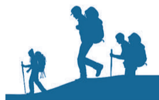
左图：游人行走在石砌古道上。