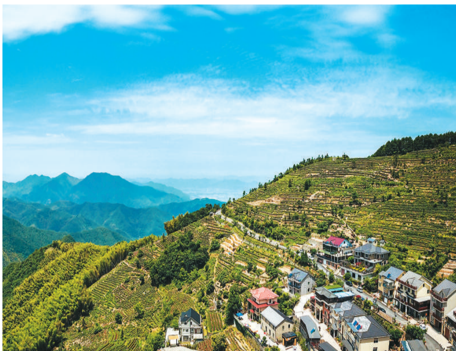
记录这樱舞茶园的美好瞬间。

我们漫步在茶园中，没想到还能看见樱花。一棵棵绚丽的樱花树，站在翠绿的茶垄之间，有的“三两抱团”，有的“形单影只”。坐在山顶的木亭里，只见山谷中的水库春水如碧，波光粼粼，茶树与樱花倒映其间，影影绰绰。一畦畦茶垄像一圈圈同心圆散落在丘陵之上，山道两旁的樱花随风舞动，好似仙女的飘带，起伏于峰峦沟壑间。我忍不住拿起相机，