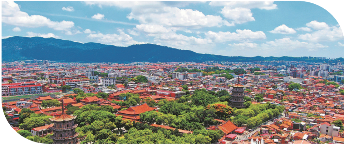
泉州的紅磚古厝，其最大特點是“三紅”：紅磚牆、紅瓦頂、紅地板磚。圖為航拍泉州西街，紅屋頂特別亮眼。