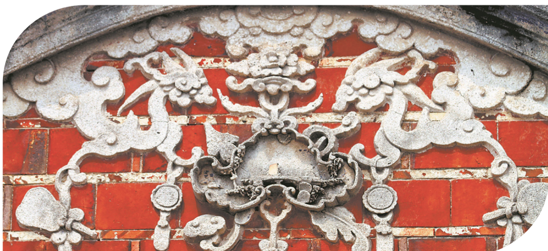
山墻墻花有安寧的寓意