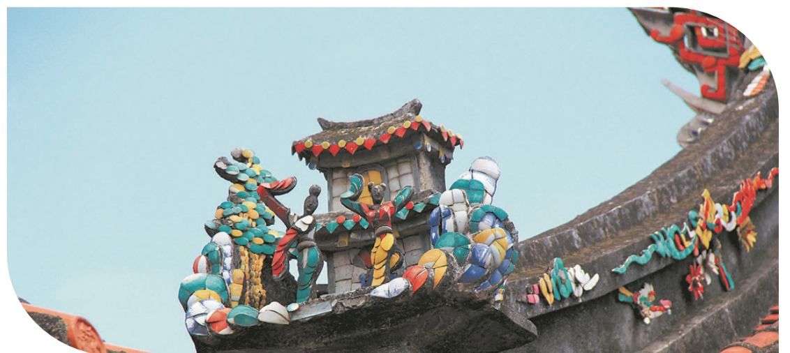
剪瓷雕是一種很出彩的裝飾手法