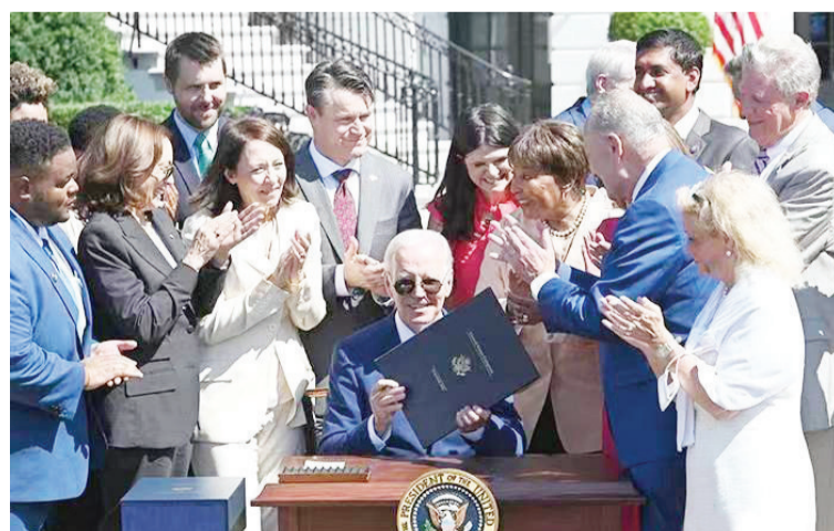
资料图：当地时间8月9日，美国总统拜登在白宫签署《芯片和科学法案》。

据彭博社介绍，美国政府正准备根据《芯片和科学法案》向芯片企业提供补贴，邀请它们在美国建厂，并提供投资税抵免优惠。但同时，也将向相