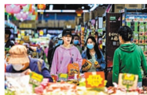
◆內地房地產市場進一步回穩，有助消費信心改善，帶動整體經濟。 中新社

不過，ING銀行大中華經濟師彭蕭曉則從最新的4月中國製造業採購經理人指數（PMI）表現來分析，認為4月PMI出乎意料地錄得49.2，意味製造業出現收縮，且大部分分項指標亦顯示今次萎縮並非短期偏差。數據顯示疲弱的出口市場或已經開始影響中國的國內經濟，因製造業弱勢容易波及服務業。故此，她預期中國政府將會推出刺激方案以振興製造業和服務業。其中一項措施或會是重啟電動車補貼，從而推動汽車銷售和生產。另一項措施可能是加快基礎設施投資，以同時推動製造業和建造業活動。