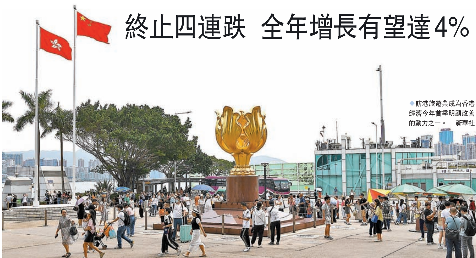
◆訪港旅遊業成為香港經濟今年首季明顯改善的動力之一。 新華社