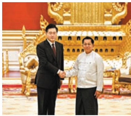
◆5月2日，緬甸領導人敏昂萊（右）在內比都會見到訪的中國國務委員兼外長秦剛。

香港文匯報訊 據新華社報道，當地時間5月2日，緬甸領導人敏昂萊在內比都會見到訪的中國國務委員兼外長秦剛。