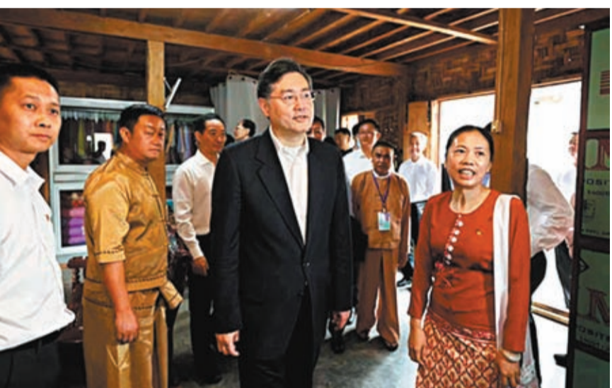
◆5月2日，秦剛實地查看了姐告國門、晚町口岸芒滿通道、瑞麗試驗區綜合展示中心和「一寨兩國」邊境社區，聽取基層單位和一線工作人員的意見建議。

中國人民大學國際事務研究所所長王義桅接受香港文匯報記者訪問時表示，緬甸與中國的關係眾所周知，在歷史上就有着非常密切的良好外交關係，緬甸是與中國共同提出和平共處五項原則的倡導者，周恩來總理也曾九次訪問緬甸。中國提出「一帶一路」倡議後，緬甸