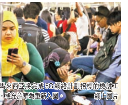
◆馬來西亞將完成5G網絡計劃招標的檢討工作，或允許華為重新入圍。

香港文匯報訊 據金融時報報道，馬來西亞當局近期將完成5G網絡計劃招標的檢討工作，或允許包括中國企業華為在內的多國通訊設備商重新入圍，承建大馬電訊基礎設施。美國和歐盟駐大馬特使為此紛紛致函大馬政府，揚言此舉會帶來「國家