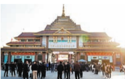
◆今年1月8日，中緬瑞麗口岸恢復通關。