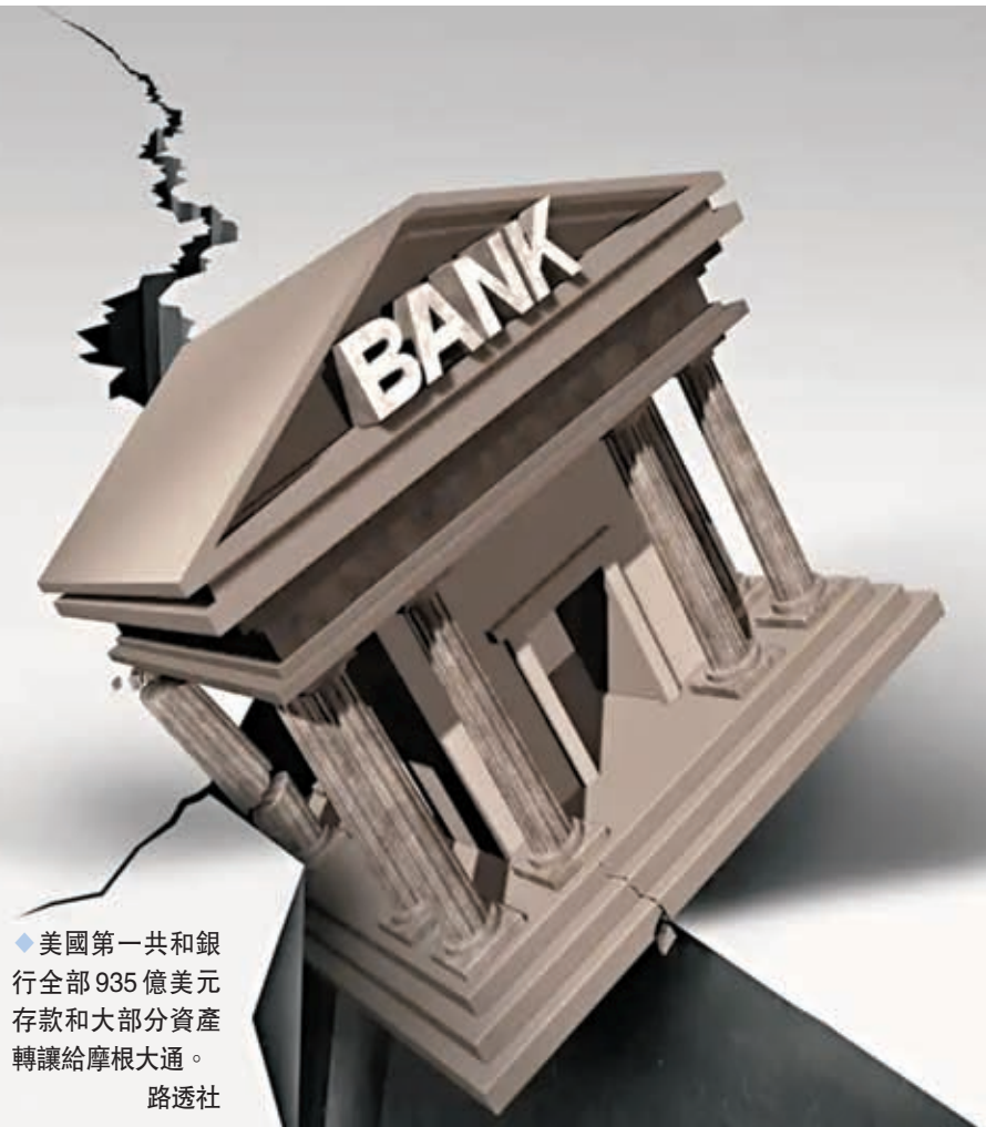
美國第一共和銀行全部935億美元存款和大部分資產轉讓給摩根大通。

截至上月中,FRB總資產約為2,291億美元。FDIC上周邀請6間金融機構參與收購FRB競標,最終接受摩通的收購建議。摩通除接收FRB所有存款及合格金融合同外,亦購入FRB幾乎所有資產,同時承擔部分負債,與FDIC共同分擔損失。