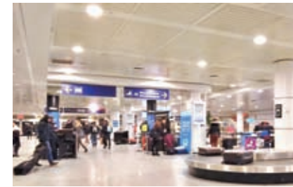
墨西哥人被指利用免簽證待遇飛抵加拿大,然後潛往美國。

聯邦移民、難民及公民部長弗雷澤的發言人表示,加拿大、美國與墨西哥緊密合作應對各種共同面對的挑戰,包括邊境安全。他指出加拿大一直監視墨西哥人非法入境美國的趨勢,但政府目前沒有計劃對墨西哥人重新實施簽證要求。