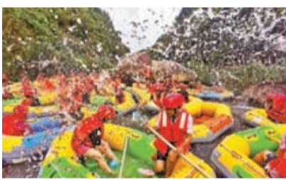
4月30日，遊客在海南省五指山市體驗紅峽谷漂流。