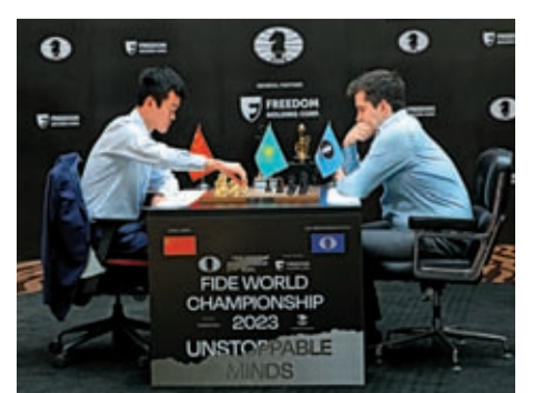
4月30日，丁立人（左）與涅波姆尼亞奇在比賽中。

本次比賽進行14盤慢棋對抗，兩人以7：7握手言和，迎來快棋加賽決勝——先進行4盤每方25分鐘每步棋加10秒快棋。前三盤快棋比賽均以和棋收場。第四局涅波姆尼亞奇執白，中局階段他稍有保守。丁立人抓住機會主動出擊，迫使對手在第47回合後出現連續失誤。最終他將優勢轉化為勝勢，加冕世界棋王。「那是一個非常情緒化的時刻。對於我來說，這是一次非常艱難的系列賽，現在我終於感到放鬆了。」丁立人在賽後發布會上說。