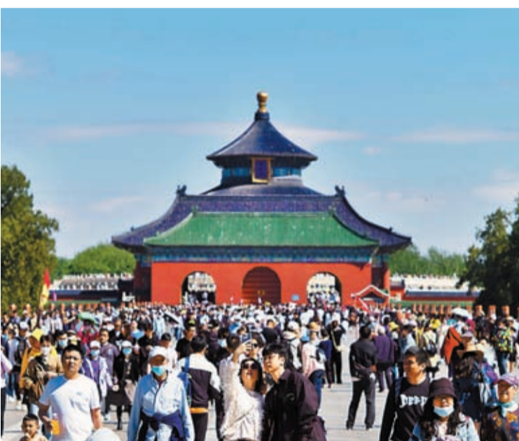
4月30日，遊客遊覽北京天壇公園。