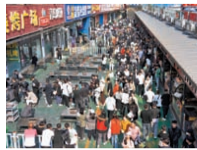
山東淄博網紅燒烤店下午4點半營業，3點半就開始排隊。