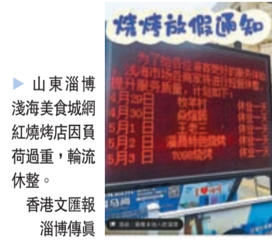
山東淄博淺海美食城網紅燒烤店因負荷過重，輪流休整。