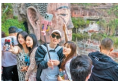
5月1日，遊客在四川樂山大佛景區自拍。

據央視新聞報導，截至4月29日15時，四川省納入統計的829家A級旅遊景區，共接待遊客361.76萬人次，實現門票收入3,233.67萬元，分別同比增長67.61%、119.34%，分別恢復到2019年同期的98.9%、93.7%。其中，樂山大佛、九寨溝、青城山-都江堰、峨眉山等景區接待人數均同比上升500%以上，門票收入同比均上漲600%以上。