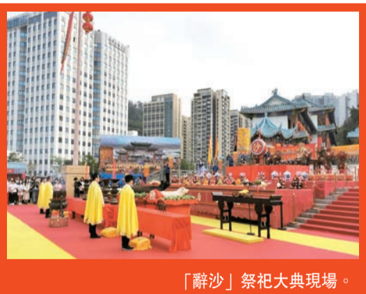
「辭沙」祭祀大典現場。

據了解，2014年開始，赤灣天后古廟遵循古禮古制，恢復「辭沙」祭海這一儀典。「辭沙」作為深圳海洋文化的重要組成部分，不僅是深圳真正的本土最深厚重要的非物質文化遺產，更重要的是，它