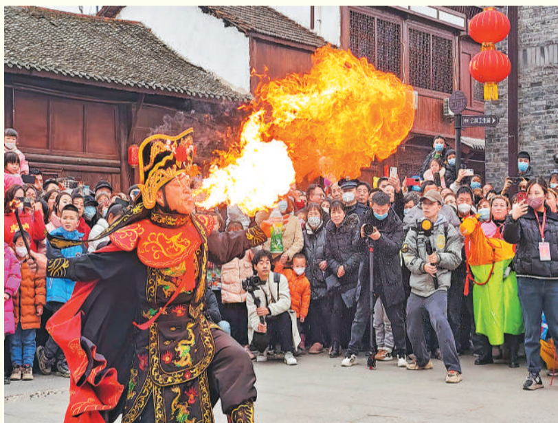
▲ 市民在四川省宜宾市翠屏区李庄古镇拍照。