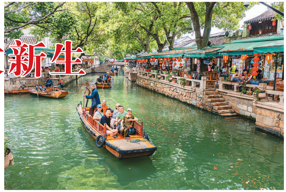
游客在江苏省苏州市吴江区的同里古镇游玩。

事实上，每个古镇历经岁月洗礼，都有独特的人文内涵、美学特质。受访专家表示，要认真梳理历史源流，充分挖掘每个古镇独特的文化符号，并做好商业化与文化保护传承之间的平衡。唯有如此，古镇发展之路才能越走越宽。