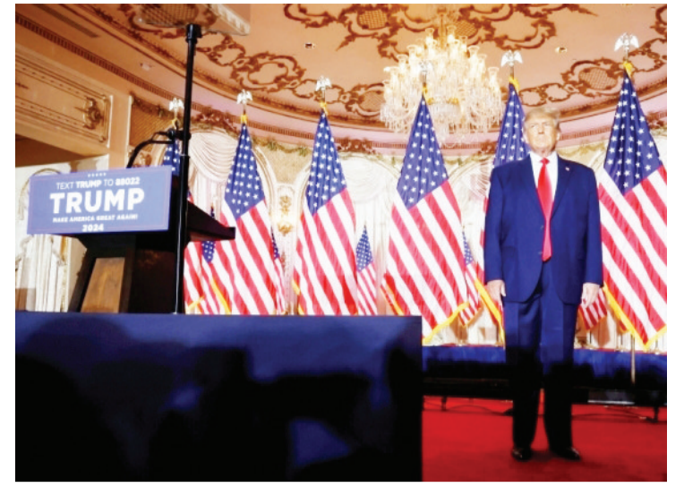
资料图：当地时间2022年11月15日，美国前总统特朗普在佛罗里达州海湖庄园发表演讲，正式宣布将参加2024年美国大选。

根据美国“枪支暴力档案”网站统计，2023年迄今，美国至少发生了174起大规模枪击事件。该网站将“大规模枪击”定义为造成四人或四人以上受伤或死亡的枪击事件，不包括枪手。 枪支暴力预防组织主席克里斯·布朗在一份声明中说，美国人不仅担心在银行、学校、超市或是教堂会成为大规模枪击案的受害者，现在甚至在自己家里，都会被攻击性武器枪杀，“在我们的规定和政策改变之前，我们将继续生活在这一可怕现实里”。