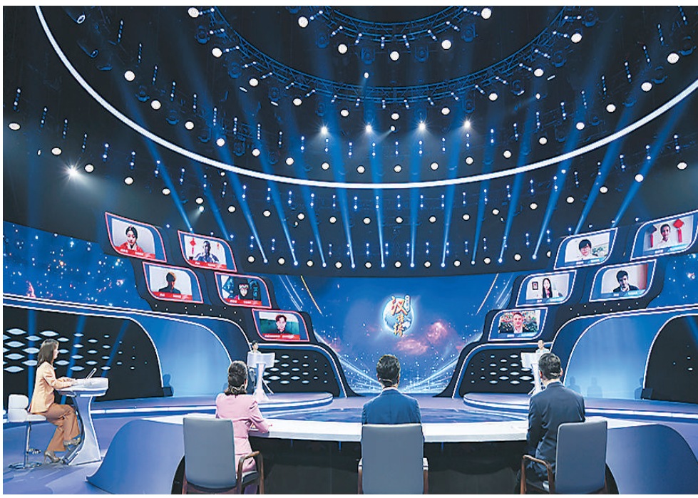
日前，由教育部中外语言交流合作中心和中央广播电视总台联合主办的第二十一届汉语桥世界大学生中文比赛播出。图为比赛现场。