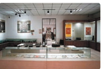
◆館內展出滿族傳統老物件1,000餘件。