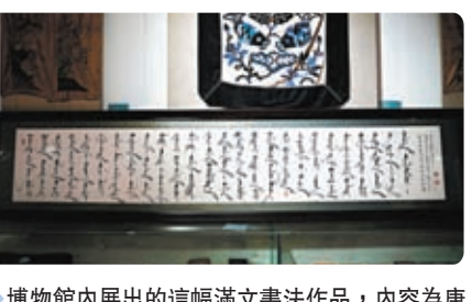
◆博物館內展出的這幅滿文書法作品，內容為康熙帝所作的松花江放船歌。