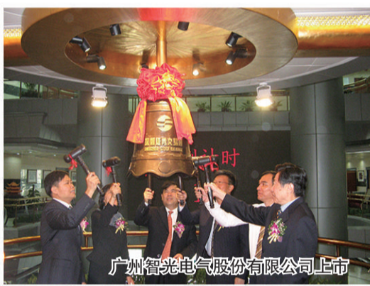
广州智光电气股份有限公司上市

广州智光电气股份有限公司(简称“智光电气”)成立于1999年,总部位于广东省广州市黄埔区,2007年在深圳证券交易所上市(证券代码:002169),目前拥有多家全资及控股子公司。公司秉持“帮助客户安全、节约、舒适地使用能源”的经营理念,专注于能源技术领域,核心业务包括数字能源技术与产品、综合能源服务、能源技术及服务领域产业投资。