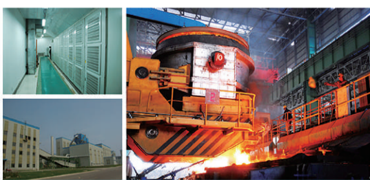
智光电气实施的首钢集团大型钢铁公司电机系统变频节能改造项目