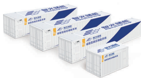
级联型高压储能产品

智光电气储能业务覆盖储能设备研发与制造、储能技术咨询等,可为广大储能客户提供系统集成、储能BMS与PACK、PCS及EMS、电芯、电池PACK及储能系统测试等核心关键技术服务及设备支持。公司储能产品序列包括电站型大储能系统(级联型高压大容量储能)、需求侧储能系统(多模组分散式集成储能)、移动储能产品及移动储能测试车(6—35kV)等,并可为不同应用场景的客户定制化提供高效率、高可靠性及高安全性的储能