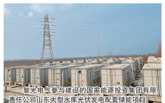
智光电气参与建设的国家能源投资集团有限责任公司山东大型水库光伏发电配套储能项目