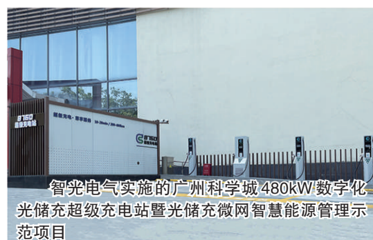
智光电气实施的广州科学城480kW数字化光储充超级充电站暨光储微网智慧能源管理示范项目