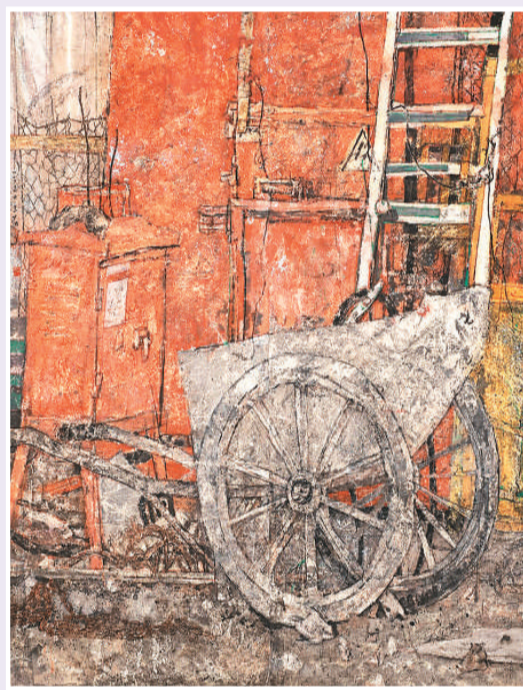
▲ 歌者无声 (中国画)