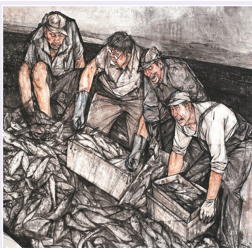
▲ 平凡铸就伟大 (中国画)