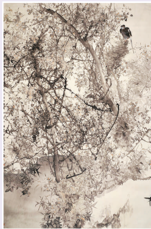
▲ 密林深处 (中国画)