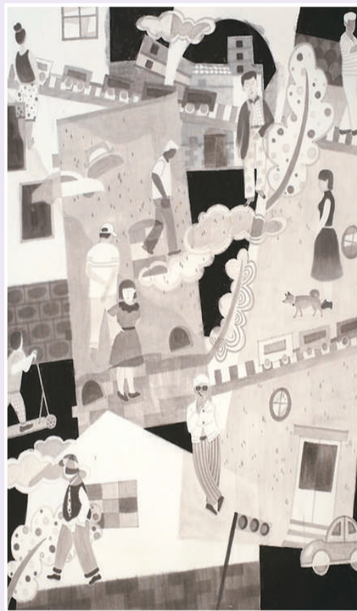
▲ 小街世相 (中国画)