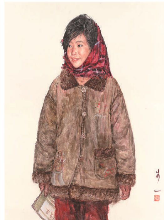
▲ 山区女学童 (中国画)