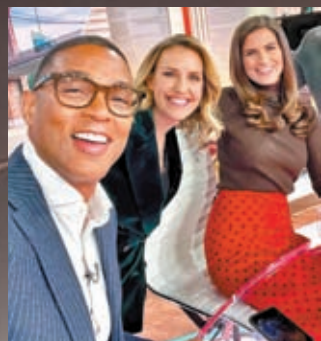
◆萊蒙(左)言行多次貶低女性，傳與節目拍檔哈洛(中)及柯林斯不和。

香港文匯報訊 美國傳媒界24日發生大地震：保守派傳媒霍士新聞突然宣布，旗下星級主持、右翼的卡爾森離職。短短幾分鐘後，自由派傳媒美國有線新聞網絡(CNN)也宣布，與名下知名主播萊蒙分道揚鑣。分析指兩間傳媒今次疑似同時「炒魷」知名主播並不尋常，尤其卡爾森離職據報是由霍士新聞老闆、傳媒大亨梅鐸親自拍板，估計今次決定與兩名主持尤其卡爾森頻繁散播虛假訊息、煽動極端情緒、發表爭議言論有關。