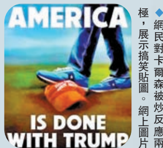
◆網民對卡爾森被炒反應兩極，展示搞笑貼圖。網上圖片