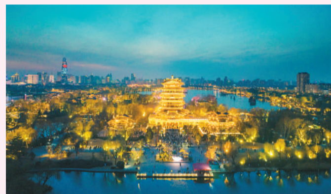
山东济南大明湖景区灯火璀璨，流光溢彩，风景如画。

为引进和留住人才，近年来，济南市拿出“真金白银”，先后出台“人才政策双30条”“高校20条”等高含金量政策，对新引进的顶尖创新创业团队和各行各业领军人才，最高给予1亿元综合补助；从人才落户、购房补贴、配套保障等细节入手，激励更多青年人才前来创业就业。