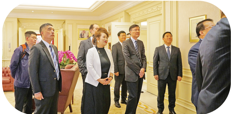
金光集团领导及访问团成员在观赏相片