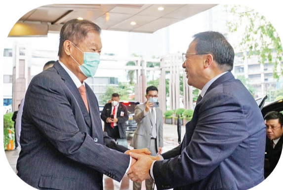
黄志源总裁热情迎接龚正市长