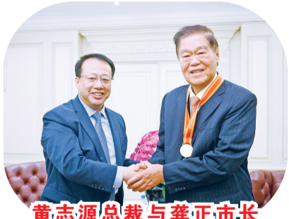
黄志源总裁与龚正市长握手表示感谢