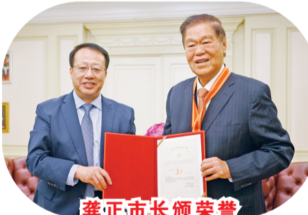
龚正市长颁荣誉市民证书予黄志源总裁