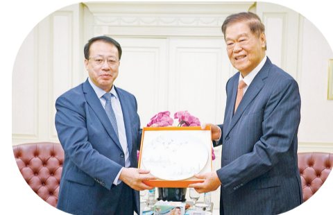
龚正市长赠纪念品予黄志源总裁