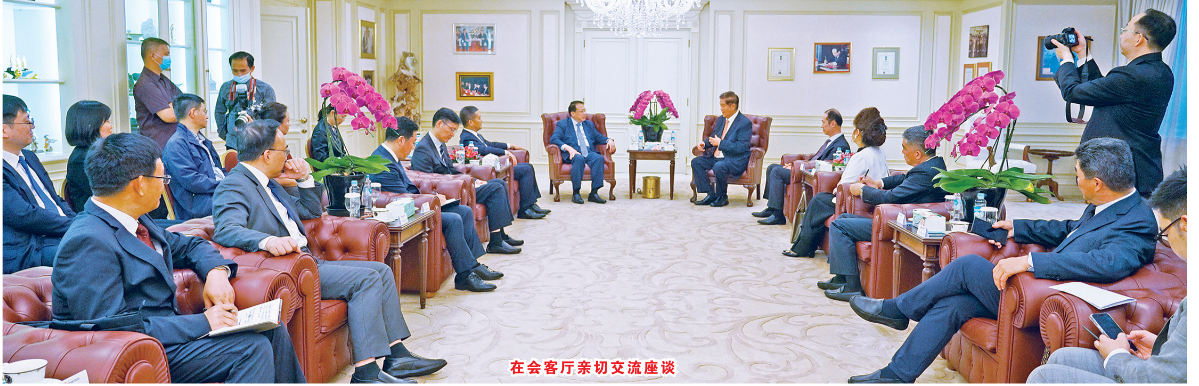
在会客厅亲切交流座谈