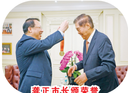
龚正市长颁荣誉市民奖牌予黄志源总裁