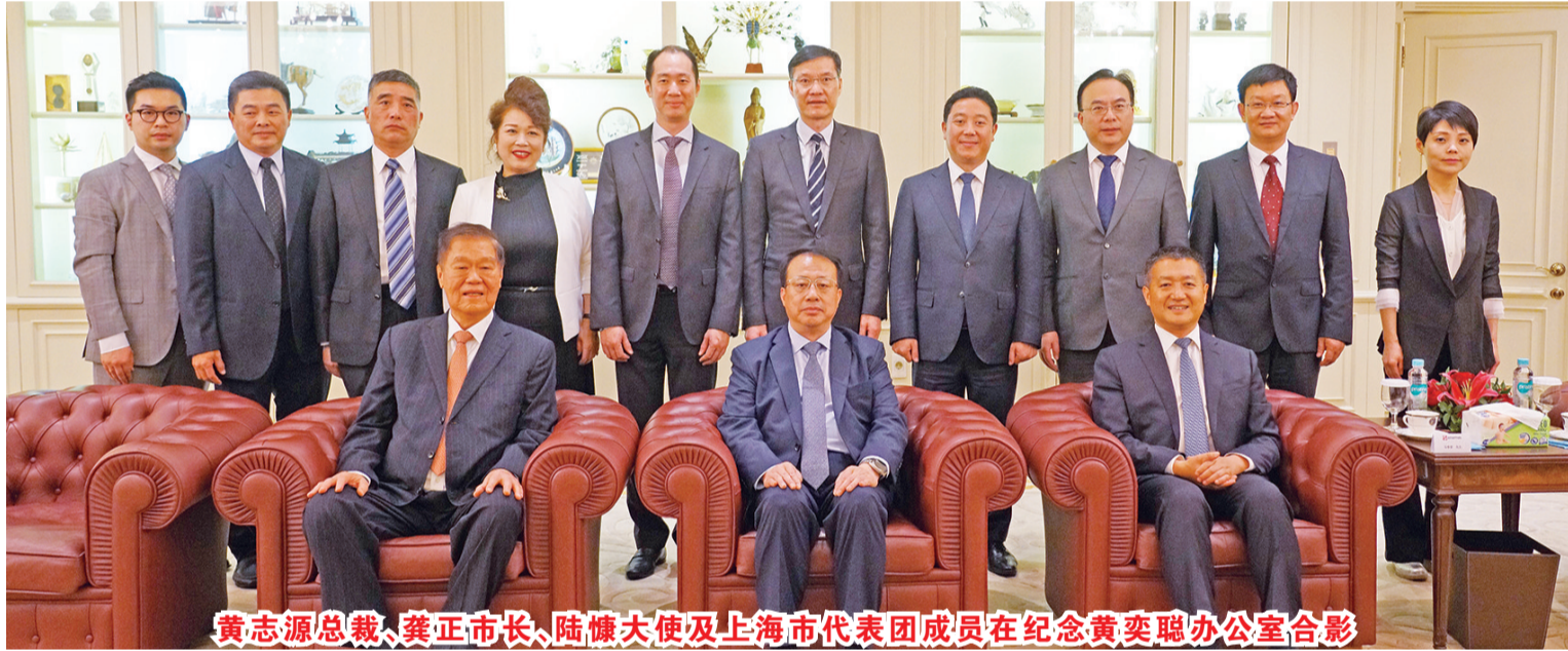
黄志源总裁、龚正市长、陆慷大使及上海市代表团成员在纪念黄奕聪办公室合影