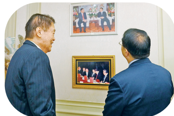
黄志源总裁陪同龚正市长观看相片