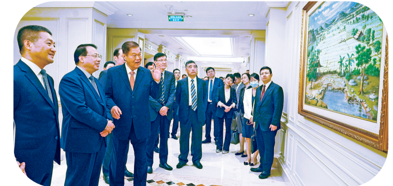
参观金光集团创办人黄奕聪办公室外的油画