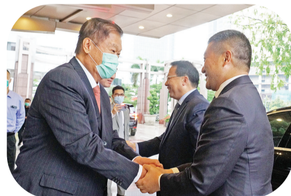
黄志源总裁热情迎接陆慷大使