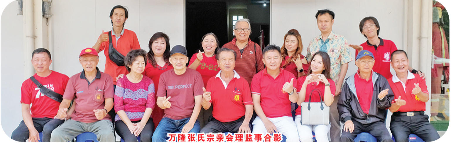
万隆张氏宗亲会理事监事合影