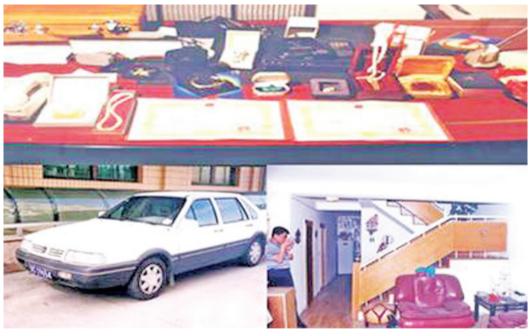
▲李洪志在北京时购买的汽车、房子、高档消费品如今，在“法轮功”网站上，李洪志高价出售全套“讲法”书籍、音像制品、敬拜檀香，价格上百元至几千元不等。

“法轮功”的神韵艺术团一年演出几百场。如按每张50-150美元门票价，粗略估计“神韵演出”票房收入达6000多万美元。演出场次多，收入