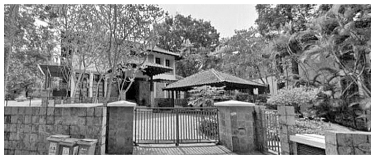
印尼富豪在狮城购置的其中一间豪宅。

【本报讯】4月25日，财政部长特别助理尤斯蒂努斯(Yustinus Prastowo)声称，希望印尼税务总署通过交换信息渠道，调查我国富豪家族在狮城购置天价地产交易。购置国外住宅的信息通常会储存在自动信息交换(AEoI)计划中。AEoI本身是一个自动财务数据信息交换系统，用于记录和监控国内外税收潜力。或者至少税务总署可以通过EoI的信