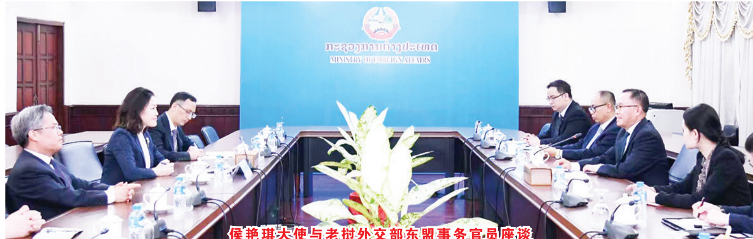
侯艳琪大使与老挝外交部东盟事务官员座谈