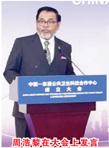
周浩黎在大会上发言

【本报讯】近几年来，随着中国-东盟经贸关系日趋经贸，在公共卫生科技上的合作也是迫及待。4月25日，印尼驻华大使周浩黎(H.E. Djauhari Oratmangun)出席了在北京大学“中国-东盟公共卫生科技合作中心”的成立大会。以下为致辞内容：