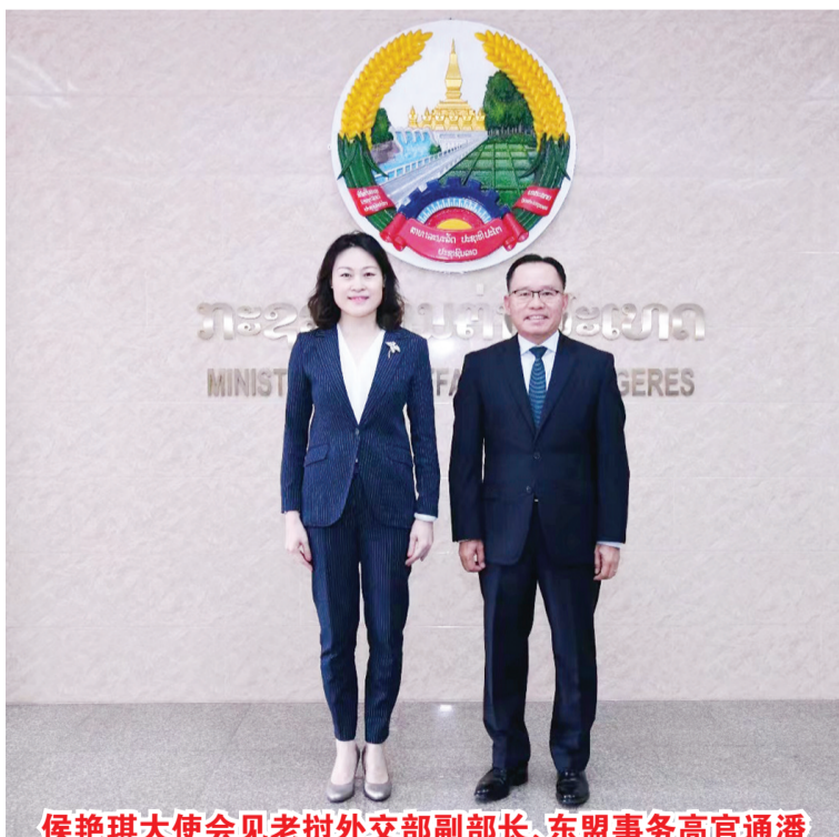
侯艳琪大使会见老挝外交部副部长、东盟事务高官通潘