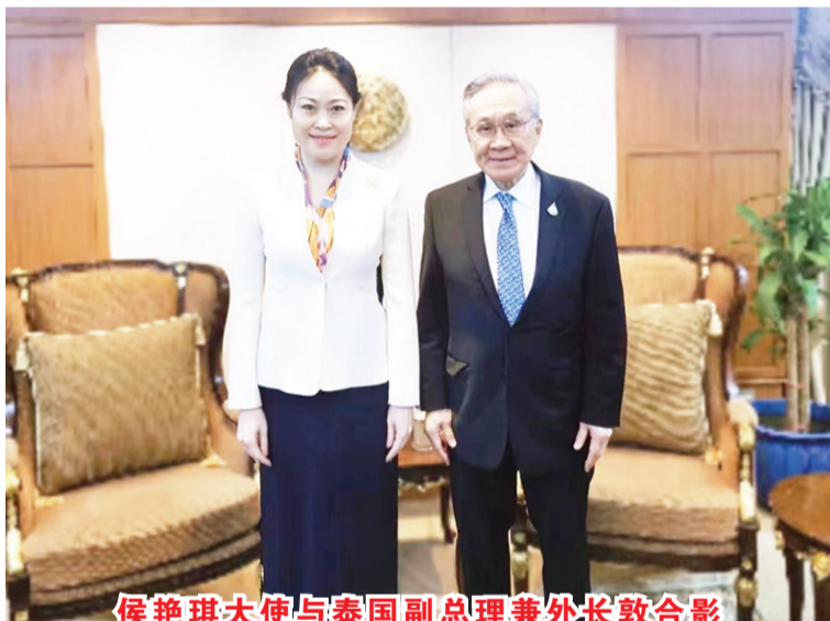
侯艳琪大使与泰国副总理兼外长敦合影

【本报讯】据来自中国驻东盟使团消息：2023年4月24日，侯艳琪大使在访问泰国期间，拜会了泰国副总理兼外长敦，就中