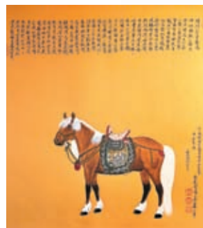
◆馬是宮廷畫的經典主題。

早年她曾雲遊內地大小城市，受邀舉辦畫展和講座，也參加了不少藝術活動，使她堅持過疫情三年的客戶由此積攢而來。她透露，今年6月將赴上海參加 Affordable Art Fair，未來也會計劃在合適的時刻繼續雲遊，帶宮廷畫走進更多人的視野。