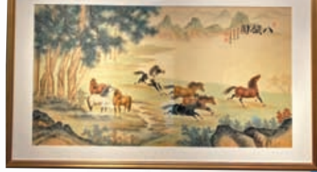
◆《八駿圖》 受訪者供圖