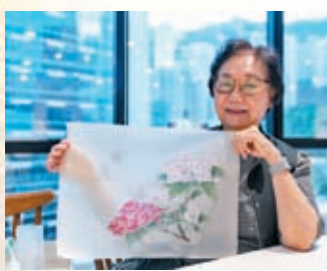
◆淑賢已跟隨恒錦學畫多年。