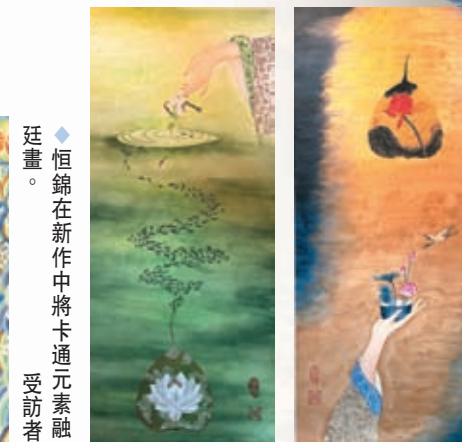
◆恒錦的作品常選擇經處理的菩提葉作為其中的一部分。