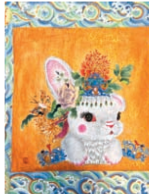
◆恒錦在新作中將卡通元素融入宮廷畫。