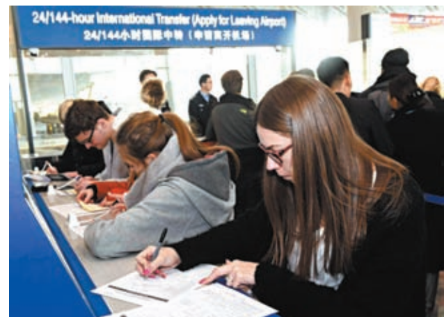
◆早前，外國旅客在北京首都國際機場T3航站樓辦理手續。 資料圖片

最後他透露，商務部將發布國別貿易指南，對重點的市場，每個國家制定一個貿易促進指南。「我們還將利用好和很多國家建立的『一帶一路』項下的貿易暢通工作組機制，推動解決中國企業在『一帶一路』沿線國家開拓市場方面所遇到的困難，增加企業的機會。在這方面，希望駐外的使領館、經商機構為企業提供便利，加大服務，特別對中小微企業開拓『一帶一路』市場，提供支持和便利。」