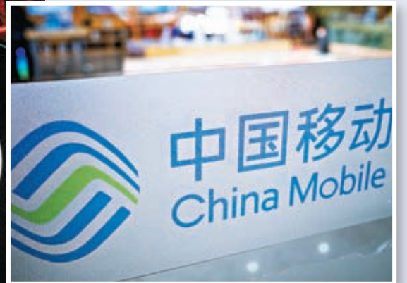
▲中國移動通信聯合會、中國電信、中國移動、中國聯通、中國廣電等 18 日宣布成立 GPT 產業聯盟，共同應對 AI 帶來的挑戰。