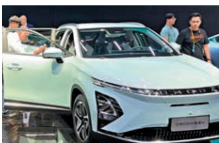
◆外籍人士圍觀觀新瑞新型號新能源車。

中國的新車型尤其是新能源車特別吸引外國展商關注。在國產車的展館內，很多外籍人士競相在給中國品牌的車拍照並上駕駛艙體驗。有些國產車裏三層外三層被外國展商圍觀，有觀眾打趣道：「這是傳統勢力集團訪問新勢力的一天。」有海外展商向香港文匯報記者表示，中國新能源車的發展速度令他們感到吃驚，特別是車內的智能化應用場景，這在海外是很罕見的。還有歐洲展商告訴記者：「早就聽聞中國新能源車很棒，這次看了蔚來、奇瑞、廣汽等中國品牌車，先進的理念值得學習。」有汽車行業分析師亦向記者表示，以往車展都是看國外品牌和合資品牌為主，但今年顯然是聚焦在自主品牌上，特別是國產車輪內的智能化體驗可謂領先全球。