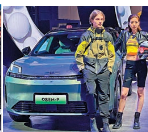
▲領克在車展上帶來多款車型。