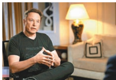
◆馬斯克指將開發極其求真的人工智能的 Truth-GPT。

香港文匯報訊 外電 18 日報道，特斯拉及 SpaceX 創始人馬斯克（Elon Musk）日前表示，他將開發