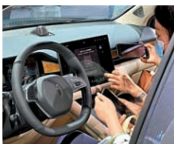
◆問界智能座艙吸引觀眾眼球。