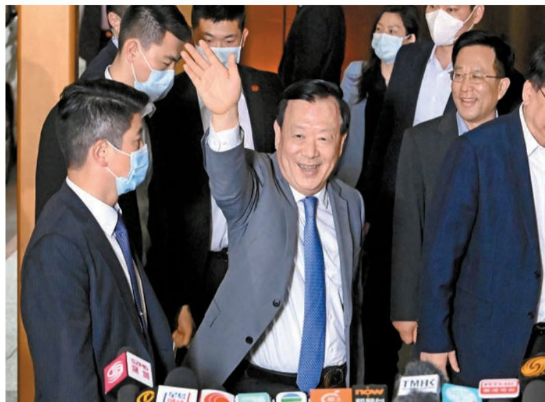
昨日，國務院港澳事務辦公室主任夏寶龍（中）結束在香港的考察，離港前在香港國際機場向傳媒揮手。

【香港商報訊】記者戴合聲報導：國務院港澳辦主任夏寶龍昨展開第六天考察香港行程後乘飛機離港。行政長官李家超在總結時表示，夏寶龍主任此行考察範圍廣泛、多元，行程非常緊密，包括在「全民國家安全教育日」作主旨講話、與社會各界人士會面，並到多區實地考察，十分認真、深入及投入，充分反映了中央及夏寶龍對香港的關心和重視。李家超引述夏寶龍主任多次表示對香港的未來充滿信心，並承諾特