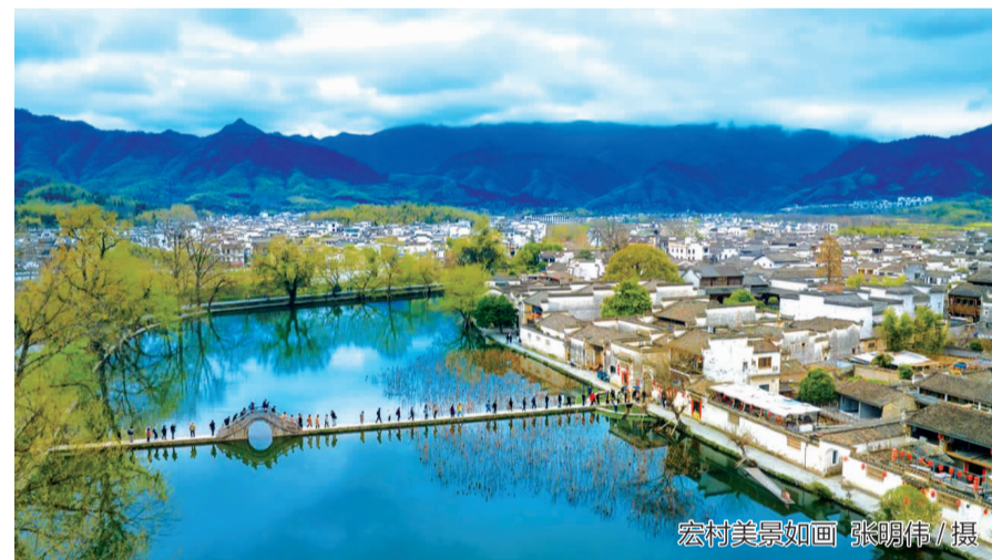
宏村美景如画