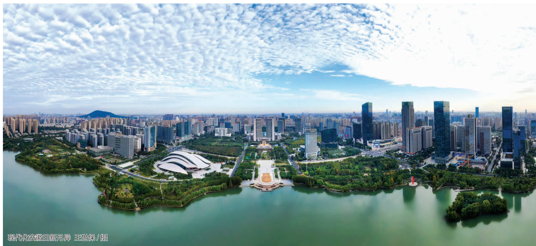
现代化安徽日新月异