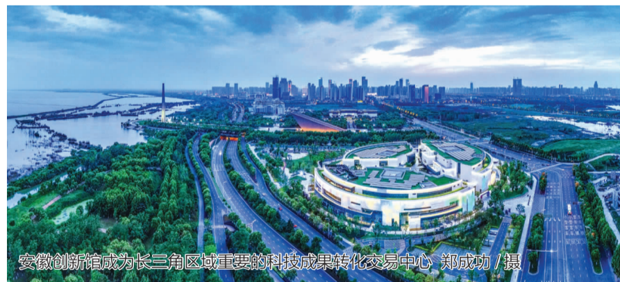
安徽创新馆成为长三角区域重要的科技成果转化交易中心