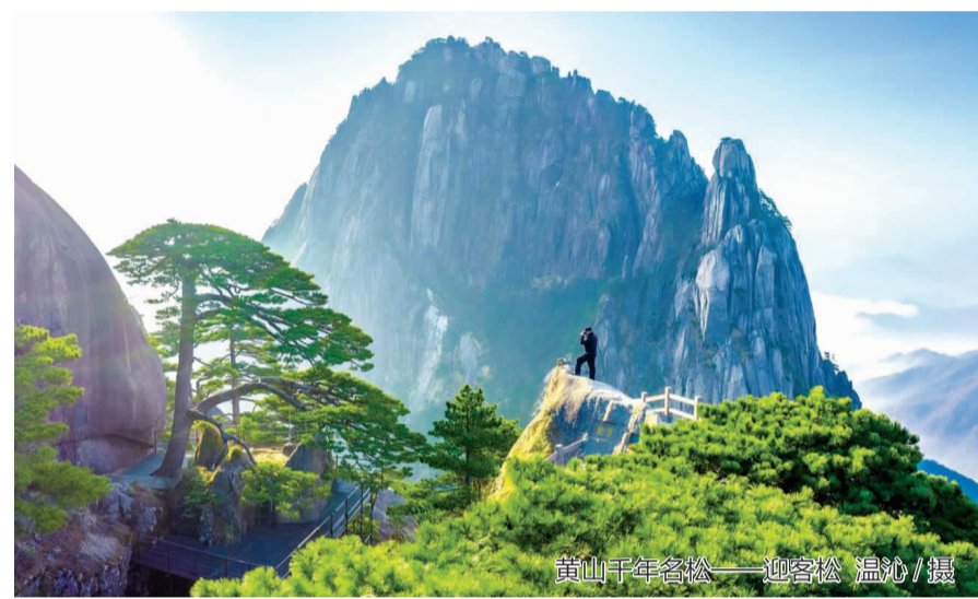
黄山千年名松——迎客松

科技创新策源地建设实现重大突破。合肥综合性国家科学中心启动建设,中国首个国家实验室落户安徽,已建在建拟建大科学装置12个。量子通信、量子计算、核聚变等领域原创成果世界领先,区域创新能力从中国第10位跃升