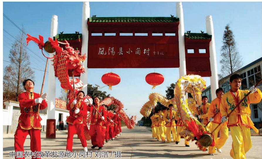
中国农村改革发源地小岗村