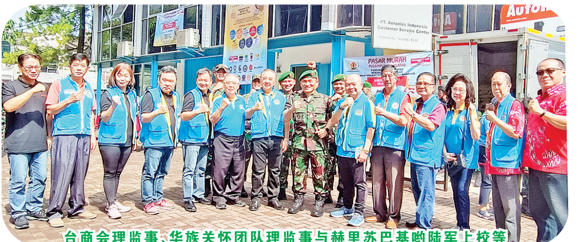
台商会理监事、华族关怀团队理监事与赫里苏巴基哟陆军上校等