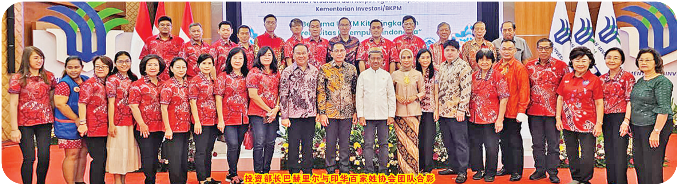
投资部长巴赫里尔与印华百家姓协会团队合影