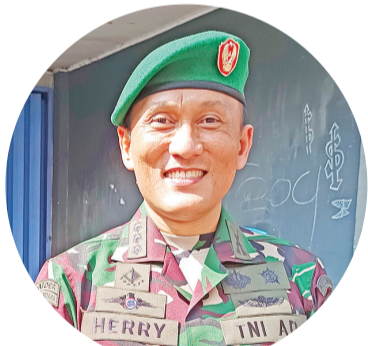
赫里苏巴基哟陆军上校讲述

【万隆讯】4月15日，万隆台湾工商联谊会 (TBC) 与万隆华族关怀团队 (MTP) 以及陆军教育训练司令部作战模拟中心 (Pussimpur Kodiklatad) 合作，在 Sendi Kencana 22 号会所路边举办大米和食油的平价活动 (Pasar Murah)。先把购物券 (Kupon) 交由当地镇长分发给经济一般的民众，而后带到现场凭券以 5 万盾买到 5 公斤优质白米和 1 公升食油，外加 5 包干面 2 包饼干为奖励。由于解禁节，穆斯林家庭多数都要做格杜卡特 (Ket-