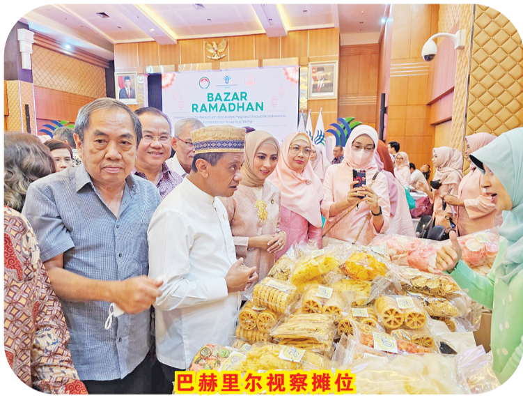
巴赫里尔视察摊位