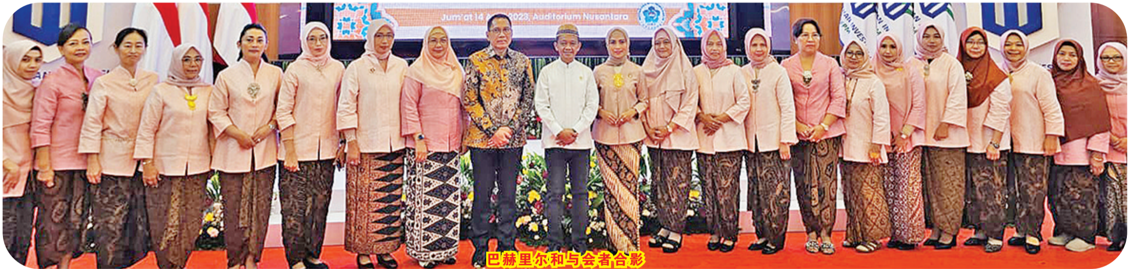
巴赫里尔和与会者合影

亨利解释说：“我们印华百家姓协会希望斋戒月集市能够成为推动中小微企业商贩继续努力和迈步前进的时刻。”